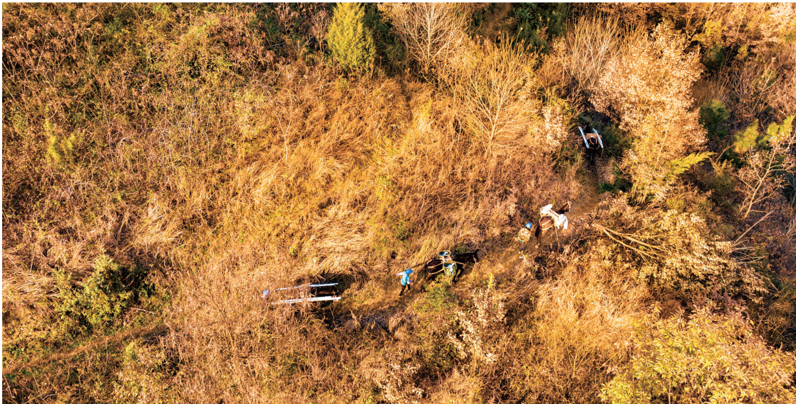
人迹罕至的高山密林是骡马队常走的地方。