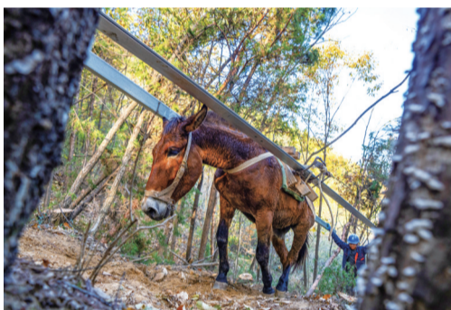
骡子驮着货物缓慢上山。