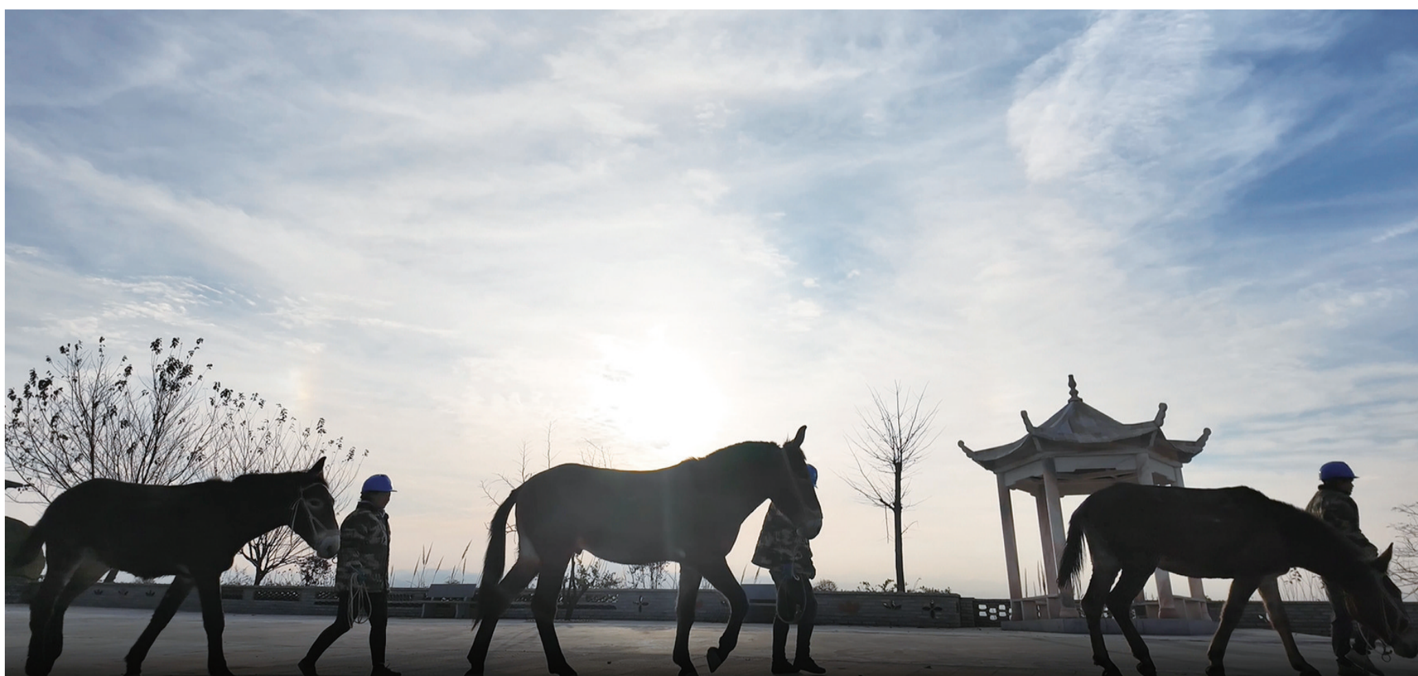
骡马队收工返回住处。