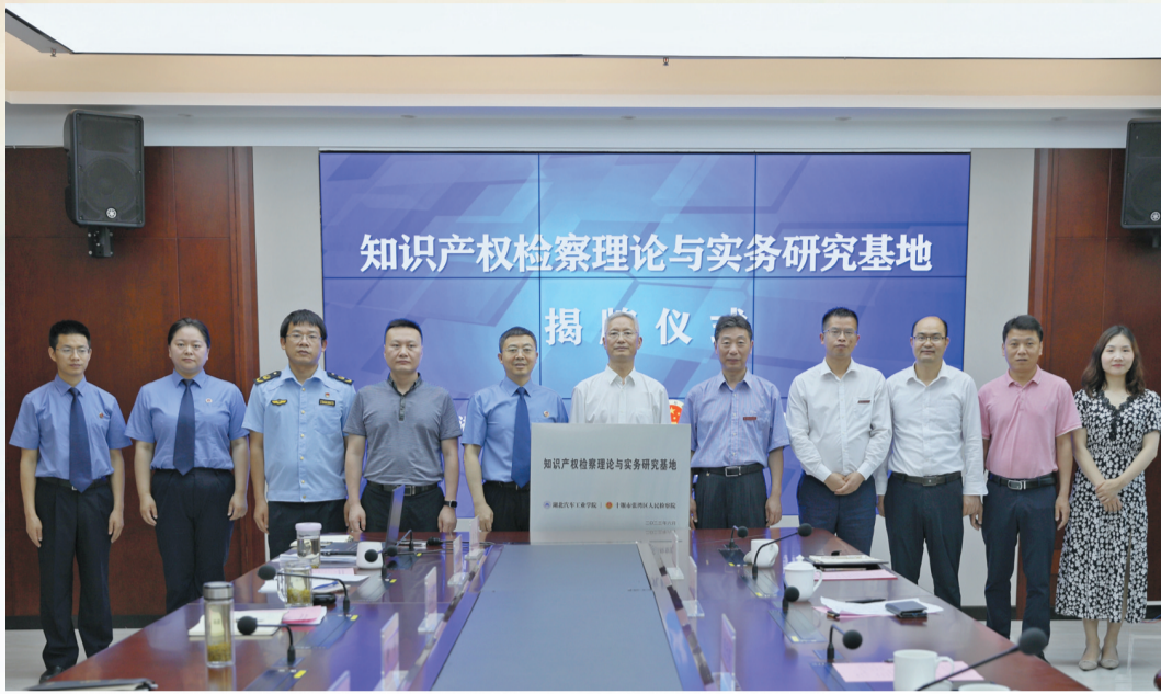
张湾区人民检察院与湖北汽车工业学院联合成立知识产权检察理论与实务研究基地。