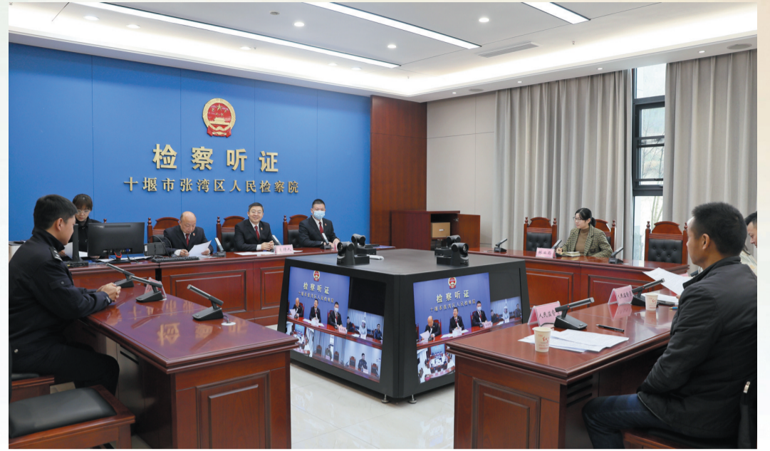
张湾区人民检察院对拟不起诉案件集中举行公开听证。

以爱民之心办利民之事，是新时代检察人的履职情怀。2023年，张湾区人民检察院深入贯彻党的二十大精神，切实扛起加强新时代检察机关法律监督工作的光荣使命，主动融入发展大局，积极回应人民群众的法治新期待，能动履职当好“法治引擎”，聚焦人民群众操心事、烦心事、揪心事，高质效办好每一个案件，让公平正义能感受、可感受、感受到。