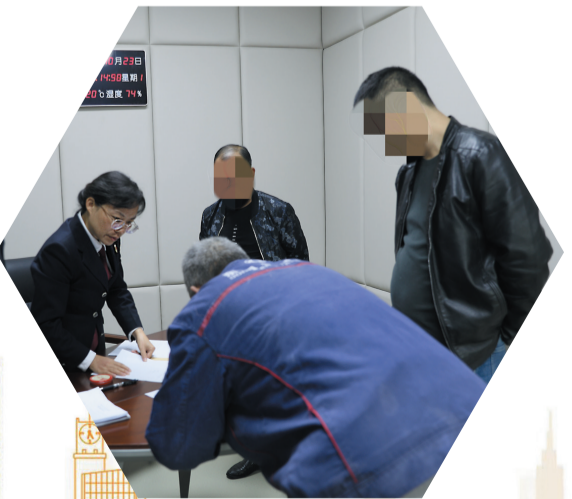
帮助农民工拿到拖欠的工资

一直以来，张湾区人民检察院直面弱势群体维权难的工作难题，聚焦民生需求，主动出击，充分发挥检察职能在保护弱势群体权益中的作用，让“小案件”释放大能量、服务大民生。