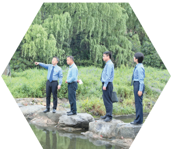
巡查辖区重点流域、重点支沟

2023年年初，张湾区人民检察院干警在日常巡河中发现，鄂河两岸蓄水线以下的河堤内存在围垦种植行为。