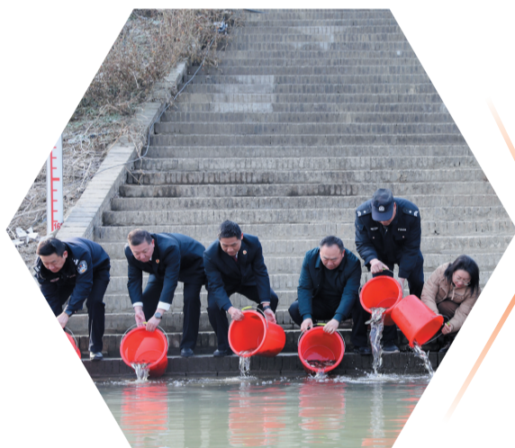
开展集中增殖放流活动

近年来，该院在办理生态环境保护领域案件时，一方面让涉案当事人增殖放流、补植复绿，以劳代偿，实现从“破坏者”到“修复者”转变，使遭受损害的生态环境及时得到修复；另一方面坚持案子办到哪里，普法就到哪里，开展“到案发地普法”活动6场次，围绕群众关心的热点、痛点问题选好典型案例，把检察办案现场搬到家门口，将枯燥的“说教式普法”转化为生动的“案例式普法”，充分发挥“身边人身边案”的警示教育作用，实现普法教育与环境保护的双赢，提升了全民生态环保意识。