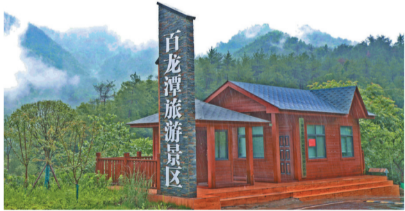
位于桃子村的百龙潭景区