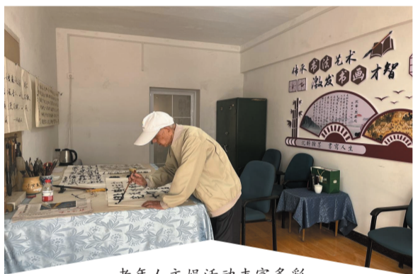
老年人文娱活动丰富多彩

循着“画卷”落笔的绝妙处追寻，一抹抹鲜艳的“党旗红”格外醒目。2023年以来，花果街道坚持党建引领，以能力作风建设为抓手，以“党建红”引领扛起共同缔造、经贸发展、小流域治理重要使命，发动群众从“旁观者”变为“参与者”，为全域加快实现“引领主城繁荣，示范乡村振兴”注入街道力量。