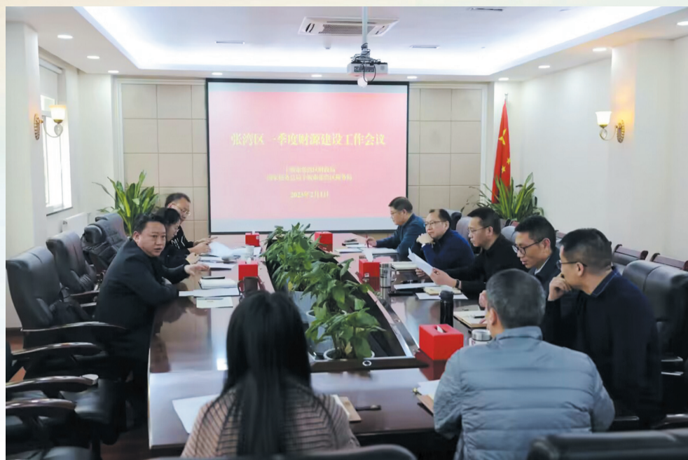
张湾区财源建设工作会议

春华秋实坚守为民初心，精耕细作换来硕果盈枝。2023年，张湾区财政局以奋斗为墨，用改革作笔，在绿色低碳发展示范区建设进程中书写财政答卷，在新时代新征程上迈出财政保民生、稳经济、促发展的坚实步伐，为张湾区经济社会高质量发展作出了积极贡献。