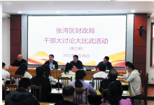
开展干部大讨论大比武活动