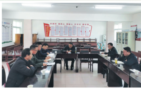
调研西沟乡西沟村产业发展情况

优化营商环境与培育优质财源相辅相成。2023年，张湾区财政局充分利用财政补助、资金引导等方式，综合运用财政、金融与产业政策，推动项目建设和产业发展，持续优化营商环境，