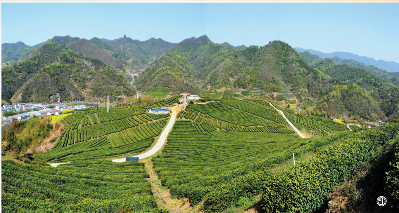
①公司3000余亩生态茶园 ②消费者青睐十星红茶醋饮料

2023年，湖北星梦茶业以系列活动为发力点，厚积薄发做强企业品牌支撑，拓宽销售市场，投身乡村振兴，展现了省级重点农业产业化龙头企业的责任与担当。下一步，企业将争创国家级重点农业产业化龙头企业。