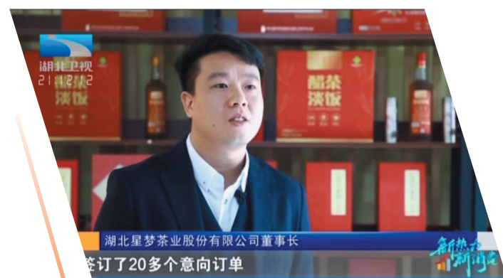
湖北星梦茶业股份有限公司董事长

2023年，星梦茶业先后参加北京市对口协作地区特色产品推介会、湖北食品产业链博览会、竹山县第二季度北京招商推荐活动、湖北省绿色食品宣传月（十堰）活动、竹溪县第九届年货节暨网红直播带货展销会等，企业总部及十堰专卖店入选十堰美食地图，十星红系列产品被越来越多消费者熟知并喜爱。