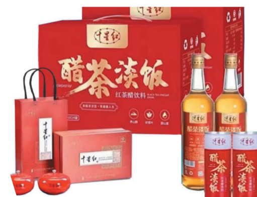
公司生产的十星红茶及醋茶淡饭红茶醋饮料