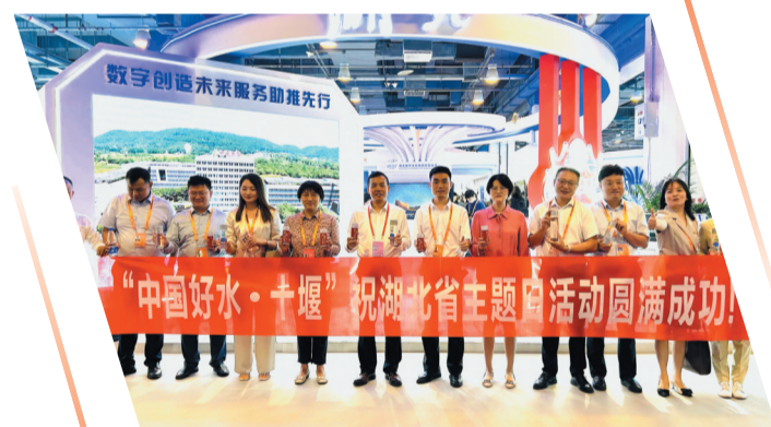
公司受邀参加2023中国国际服务贸易交易会湖北省主题日活动