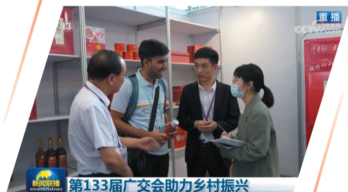
第133届广交会助力乡村振兴