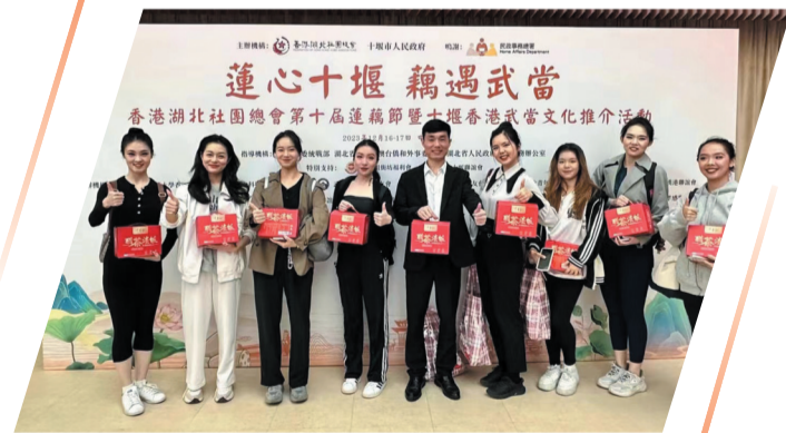
公司系列产品亮相香港湖北社团总会第十届莲藕节暨十堰香港武当文化推介活动