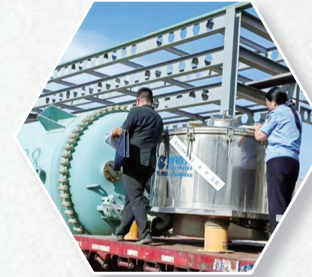
市中级人民法院执行干警6天跨越1700多公里执行13辆大卡车238套设备。

加大强制执行力度。开展“凌晨利剑”“荆楚雷霆”等集中强制执行活动178次,拘传、拘留2735人,移送拒执罪19人。善用执行强制措施,累计线上查封财产线索14356件次,网络司法拍卖成交额超过2.7亿元,为当事人节约佣金1093.29万元。