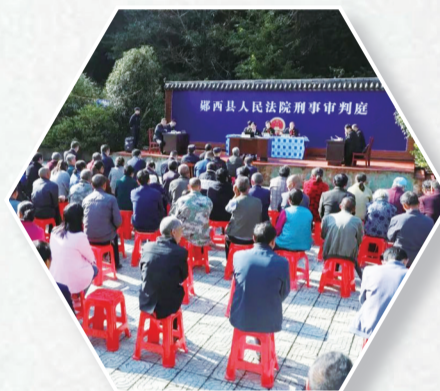
郧西县人民法院在观音镇土岭沟村开展巡回审判。

保障绿色低碳发展。深入践行“两山”理念,创新环境资源审判“六个一律”工作机制,全市法院共审结环境资源案件288件,打造生态司法保护“十堰模式”。扩大生态司法保护“朋友圈”,建立“司法+行政”综合治理机制,与公安局、检察院、生态环境局等部门开展执法协作、流域巡查,邀请代表委员联合开展“碳汇”案件“回头看”,做好环境资源审判“后半篇文章”。