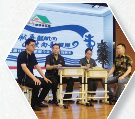
市中级人民法院青年干警为市重庆路小学师生送去法治教育课。

保障绿色低碳发展。深入践行“两山”理念,创新环境资源审判“六个一律”工作机制,全市法院共审结环境资源案件288件,打造生态司法保护“十堰模式”。扩大生态司法保护“朋友圈”,建立“司法+行政”综合治理机制,与公安局、检察院、生态环境局等部门开展执法协作、流域巡查,邀请代表委员联合开展“碳汇”案件“回头看”,做好环境资源审判“后半篇文章”。