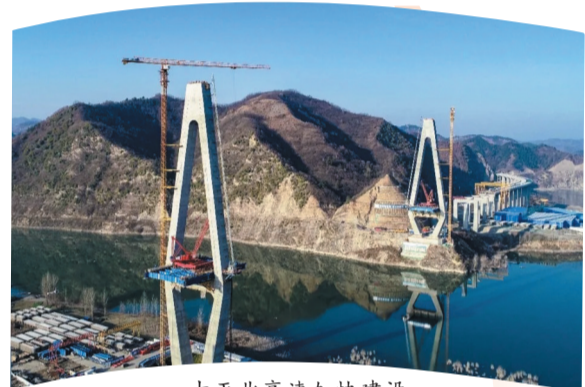
十巫北高速加快建设

“进入入库”，2条省道拟调整为国道，14条农村公路拟提升为省道。交通强国试点即将获批。十巫北高速公路完成总投资的70%，十巫南高速公路实质性开工，房神高速公路即将开工，十巫高速公路北延段启动前期工作。全年建成一二级公路90公里，城市向东发展快速通道城区段即将建成通车，十房一级路等“6+1”干线通道建设全面提速。