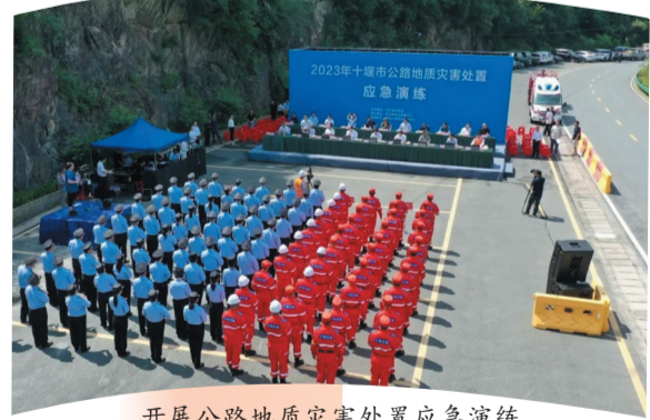
开展公路地质灾害处置应急演练