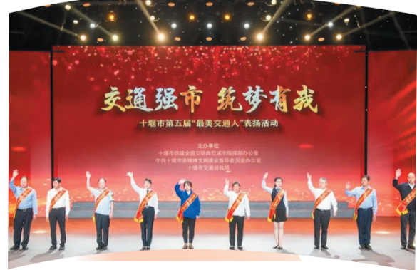
全市第五届“最美交通人”颁奖典礼举行