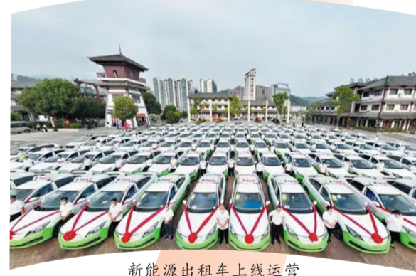
新能源出租车上线运营

能网联时代。加速营运车辆电动化进程，全年新增及更新新能源出租车（含网约车）685台、新能源公交车180台，新增及更新新能源出租车、公交车占比达100%。推动“近零碳”驾校建设，城区6家驾校推广使用新能源教练车69台。丹江口库区成为全省绿色智能船舶产业发展“先行先试”重点区域，全年建成纯电动船舶4艘。持续做好船舶和港口污染防治。全市在营船舶“船E行”使用率和三类污染物运转处率率达100%。