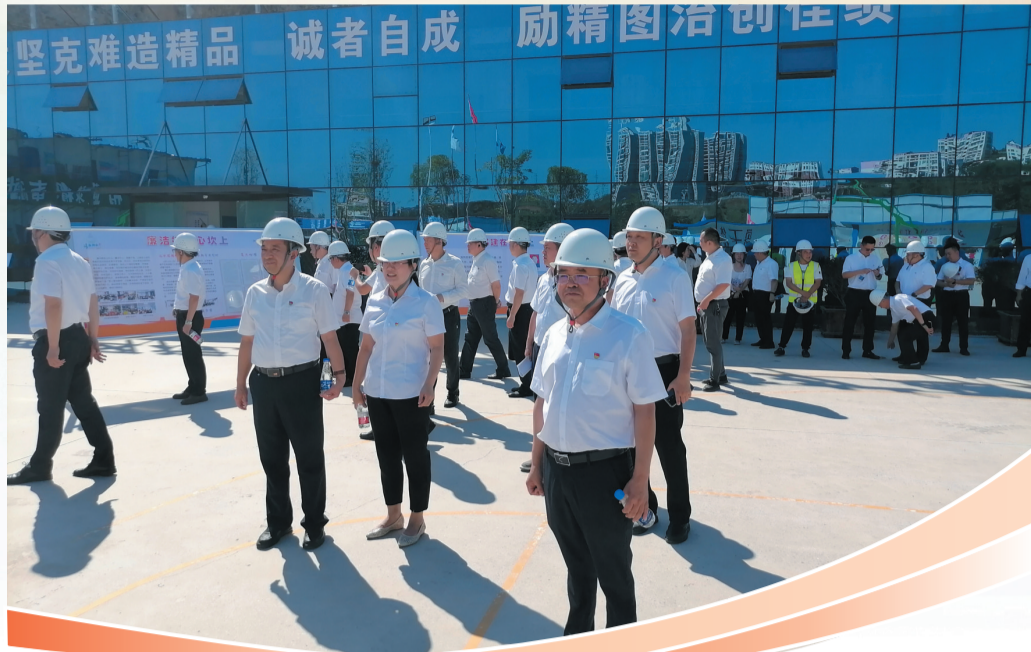
2023年全市清廉国企建设现场会

党的二十大报告指出：“深化国资国企改革，加快国有经济布局优化和结构调整，推动国有资本和国有企业做强做优做大，提升企业核心竞争力。”2023年以来，市政府国资委以党的二十大精神为指引，紧扣“国企出资人、国资监管人、党建负责人”职责定位，坚持聚焦主业发展实业，抓改革、优布局、严监管、强党建、防风险，不断增强国资影响力、国企竞争力，为我市经济社会高质量发展贡献国资力量。