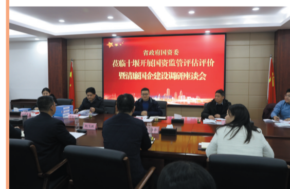
省政府国资委调研我市国资监管和清廉国企建设工作