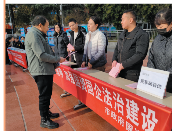
开展宪法宣传“进广场、进企业、进体系”活动