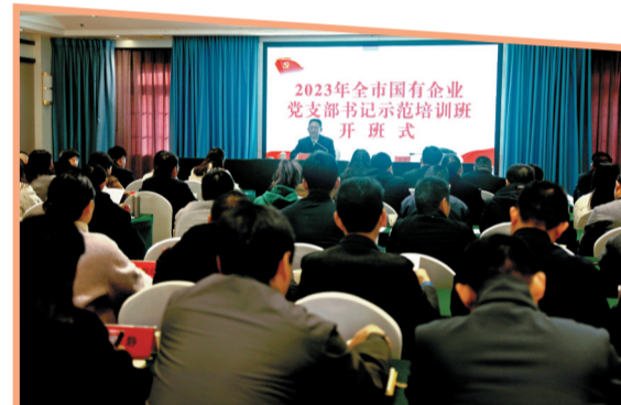
全市国有企业党支部书记示范培训班

改革无止境，扬帆再出发。市政府国资委将在市委市政府领导下，继续以靠前担当、争先进位的责任感和使命感，全力实施国有企业改革深化提升行动，为绿色低碳发展示范区建设作出新的更大贡献。