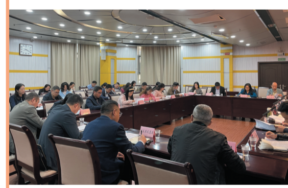
市属国有企业资产清查工作会议