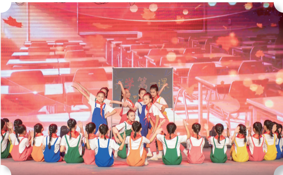
在教师节庆祝活动中，市重庆路小学学生表演了舞蹈《第一课》。