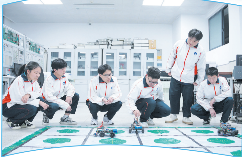
学生认真开展电子信息技术备赛

习近平总书记强调,在全面建设社会主义现代化国家新征程中,职业教育前途广阔、大有可为。