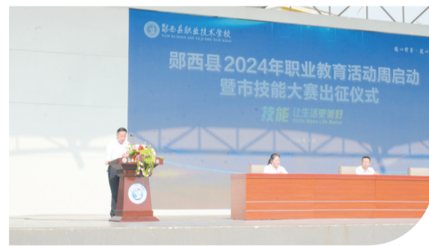
举办技能大赛出征仪式