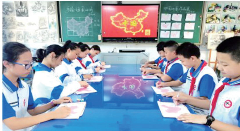
东风二中社团活动丰富多彩。