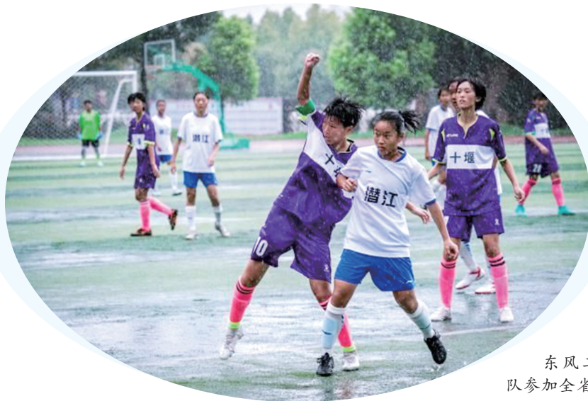
东风二中足球队参加全省比赛。