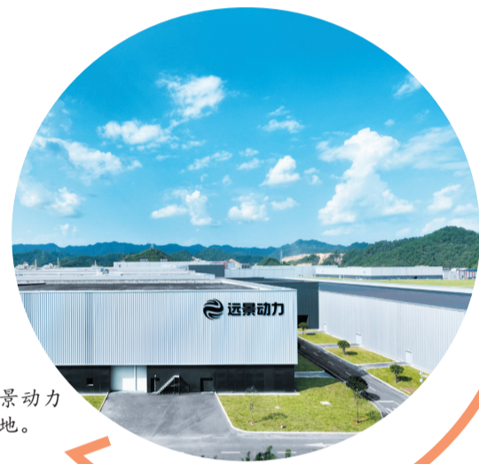
远景动力十堰基地。

深化投资项目绩效综合评价改革。对项目前期、工期、“两算”、“三评”实施“红黄绿”灯预警督办,“三库”转化率达60%,开、竣工率达80%,结算决算率达到70%,实现政府投资项目有效率,社会投资项目有效益。