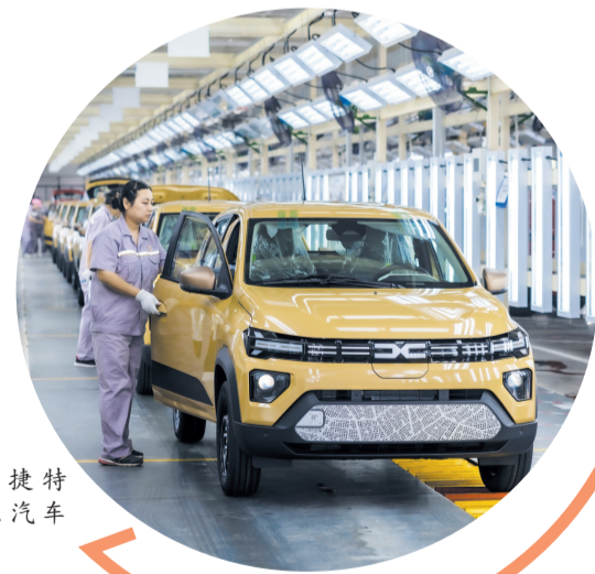
易捷特新能源汽车下线。

凝心聚力促发展,奋楫笃行开新局。2025年,全市发展改革系统将围绕中心、聚焦主责、服务大局,力推经济社会高质量发展再上新台阶,奋力谱写中国式现代化十堰篇章。