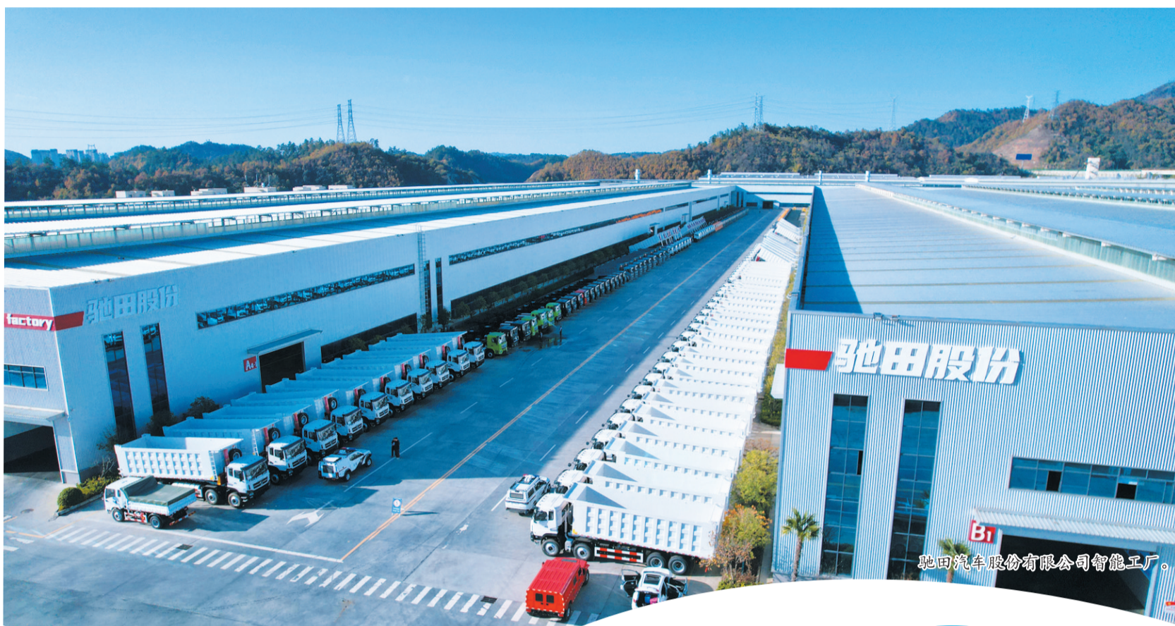
驰田汽车股份有限公司智能工厂。

回眸刚刚过去的2024年,全市发展改革工作坚决扛牢稳增长重任,坚持“三向”发力——项目向“优”、产业向“新”、发展向“绿”,引领十堰经济大船沿着高质量发展航道破浪前行。