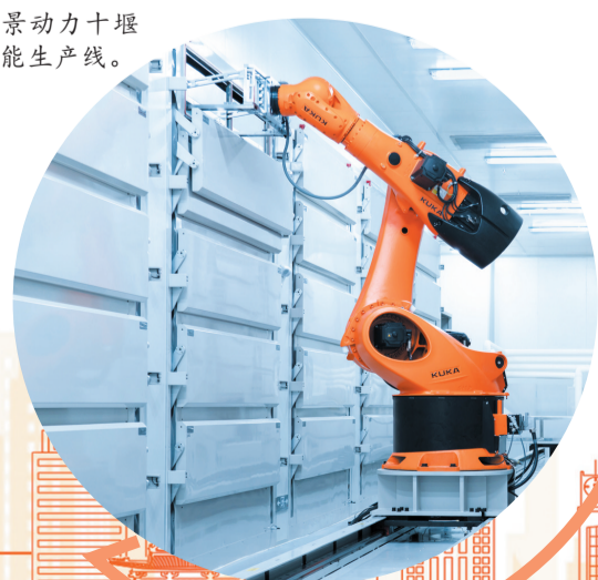
远景动力十堰基地智能生产线。