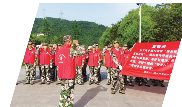
放马坪老兵中队宣誓积极行动，当好“守井人”。