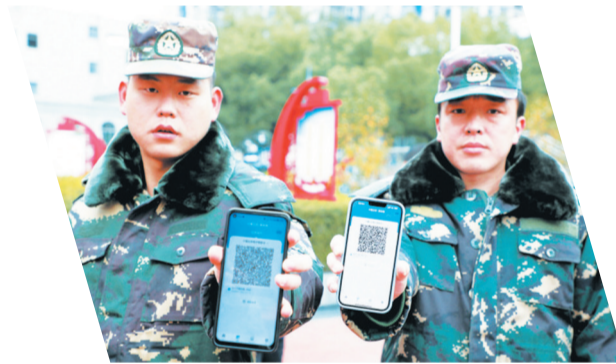
退役军人持电子荣誉卡可以免费乘坐公交车。