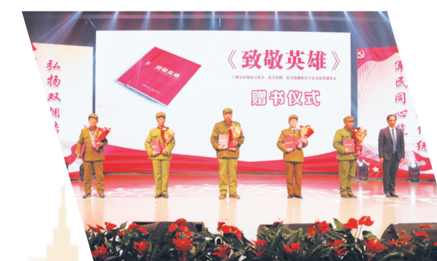
向老兵捐赠图书《致敬英雄》。