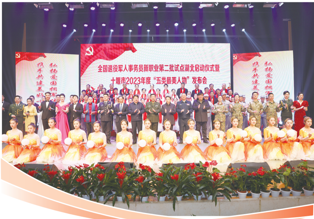
全国退役军人事务员新职业第二批试点湖北启动仪式暨十堰市2023年度“五类最美人物”发布会在我市举行。