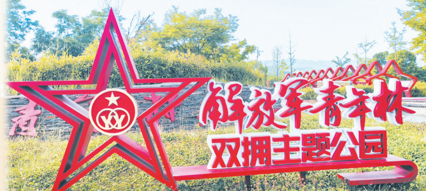
市民可以在郧阳区解放军青年林双拥主题公园与革命历史“对话”。