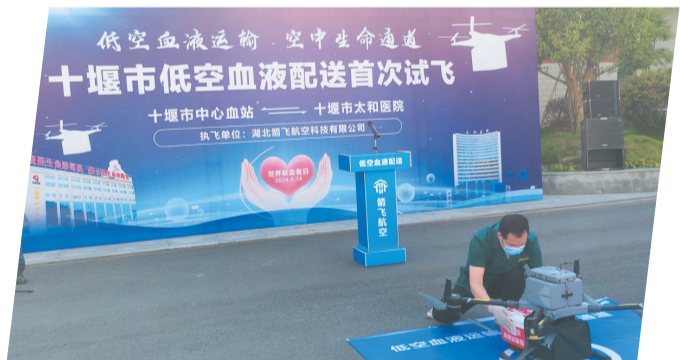
十堰市低空血液配送首飞。