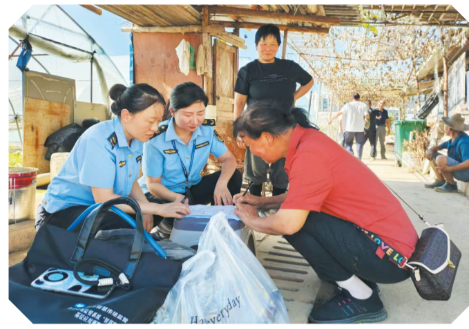
执法人员开展农产品农药残留速测。

支队搭建学习大讲台,开展“每月一讲”,组织执法专家讲授法律法规知识和执法办案技巧,累计参加培训执法人员达450余人次,人均培训时长约30课时。成立由35名执法骨干组成的执法研学小组,定期开展集中培训、业务研学、案件办理、知识评测。