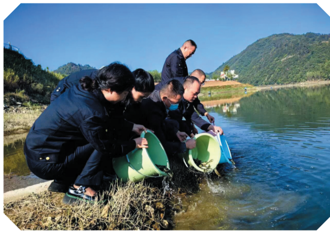
执法人员在堵河开展生态补偿增殖放流。