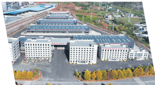
鄂西鄂西北交通物流产业园。