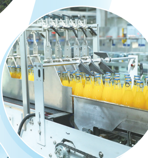
一轻食品(丹江口)有限公司生产的橘汁。