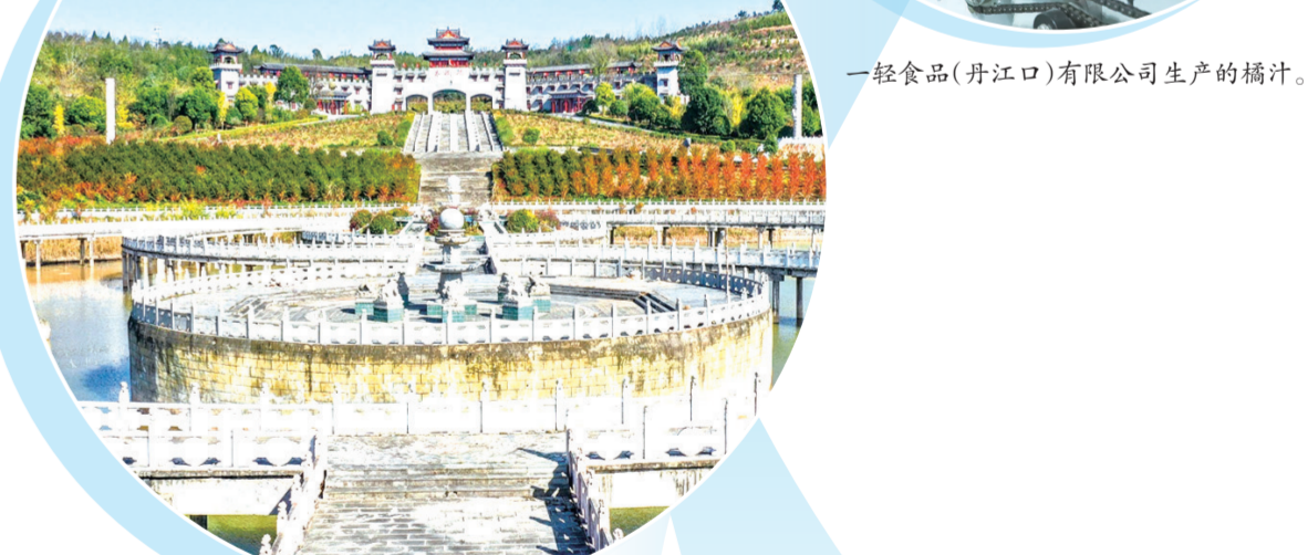
风景秀丽的大板峡景区。