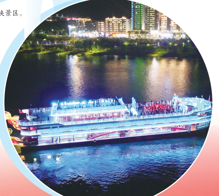
乘坐“南水北调号”游轮夜游汉江。