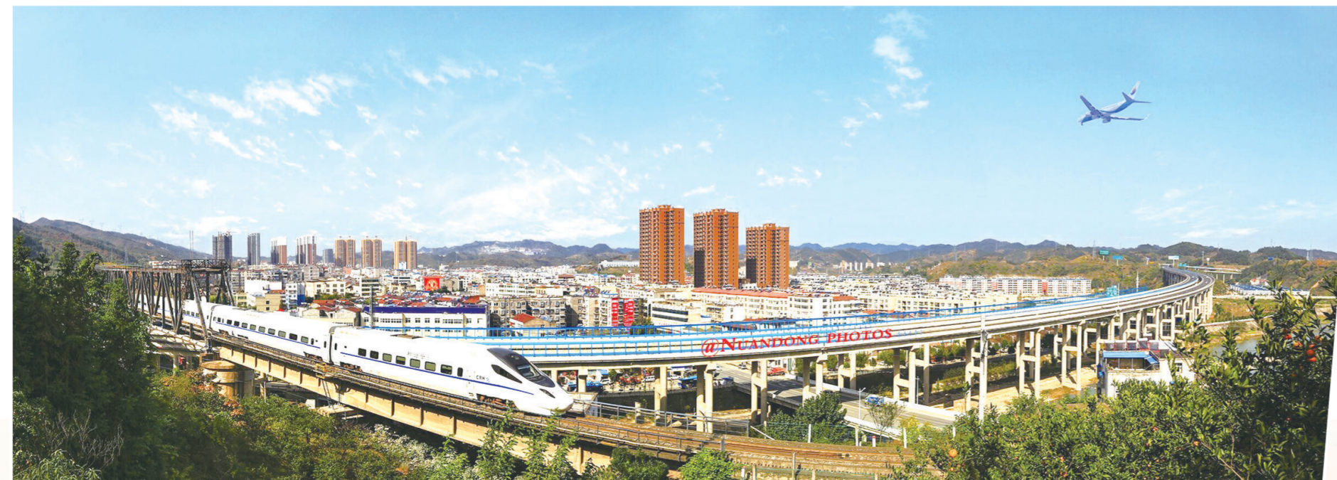
丹江口市六里坪镇。