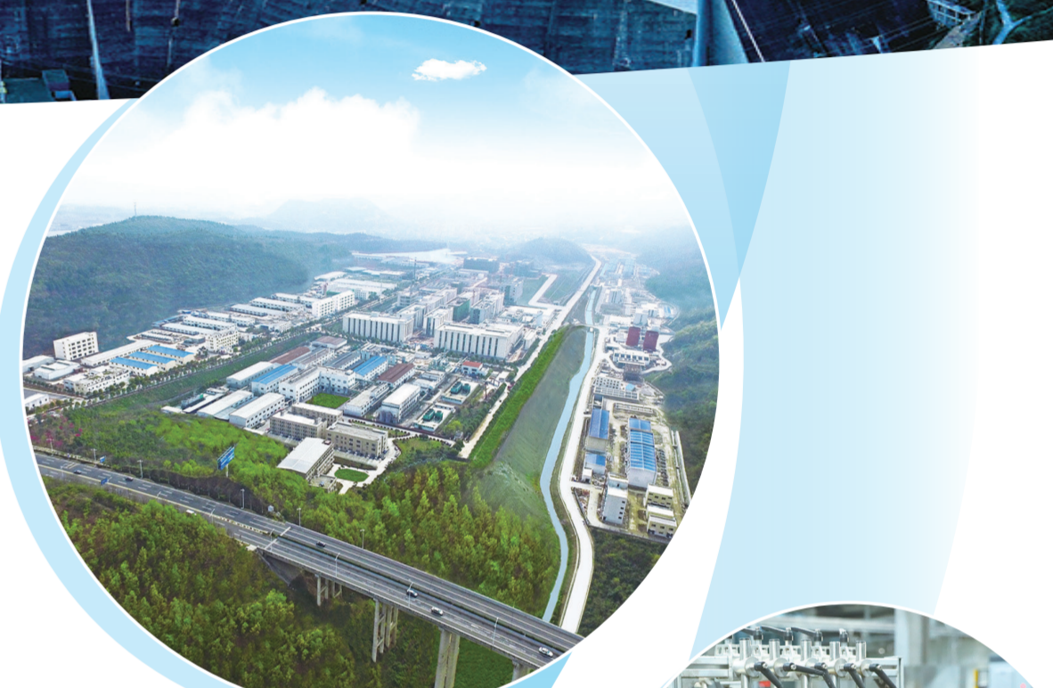
丹江口市生命健康产业园。