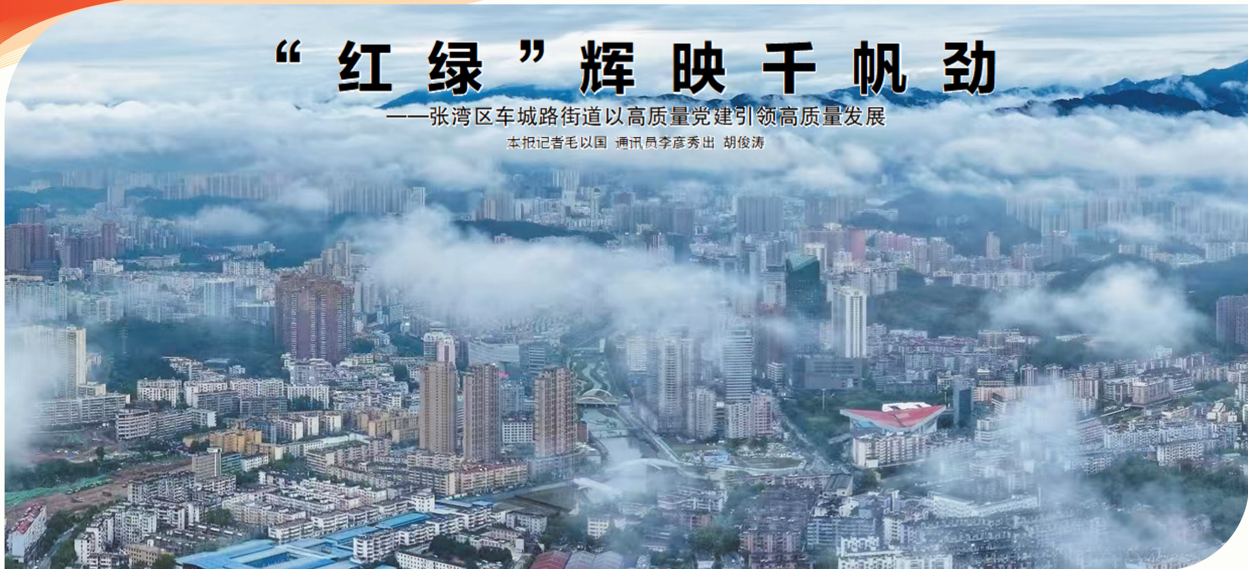
车城路街道辖区高楼林立、交通便捷、活力四射。

一抹炽热的“党建红”如旭日破晓,照亮基层治理的崭新征途;一片蓬勃的“生态绿”似春潮涌动,润泽幸福家园的碧水青山。在“红”与“绿”的交相辉映中,张湾区车城路街道锚定服务湖北加快建成中部地区崛起的重要战略支点核心任务和张湾区“千亿级示范区”建设目标,奋力绘就治理提效、生态优美、经济腾飞的高质量发展新画卷。