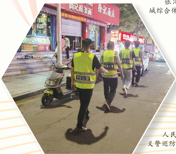
人民广场社区平安义警巡防队伍。