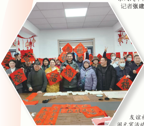
友谊社区举办邻里闹元宵活动。