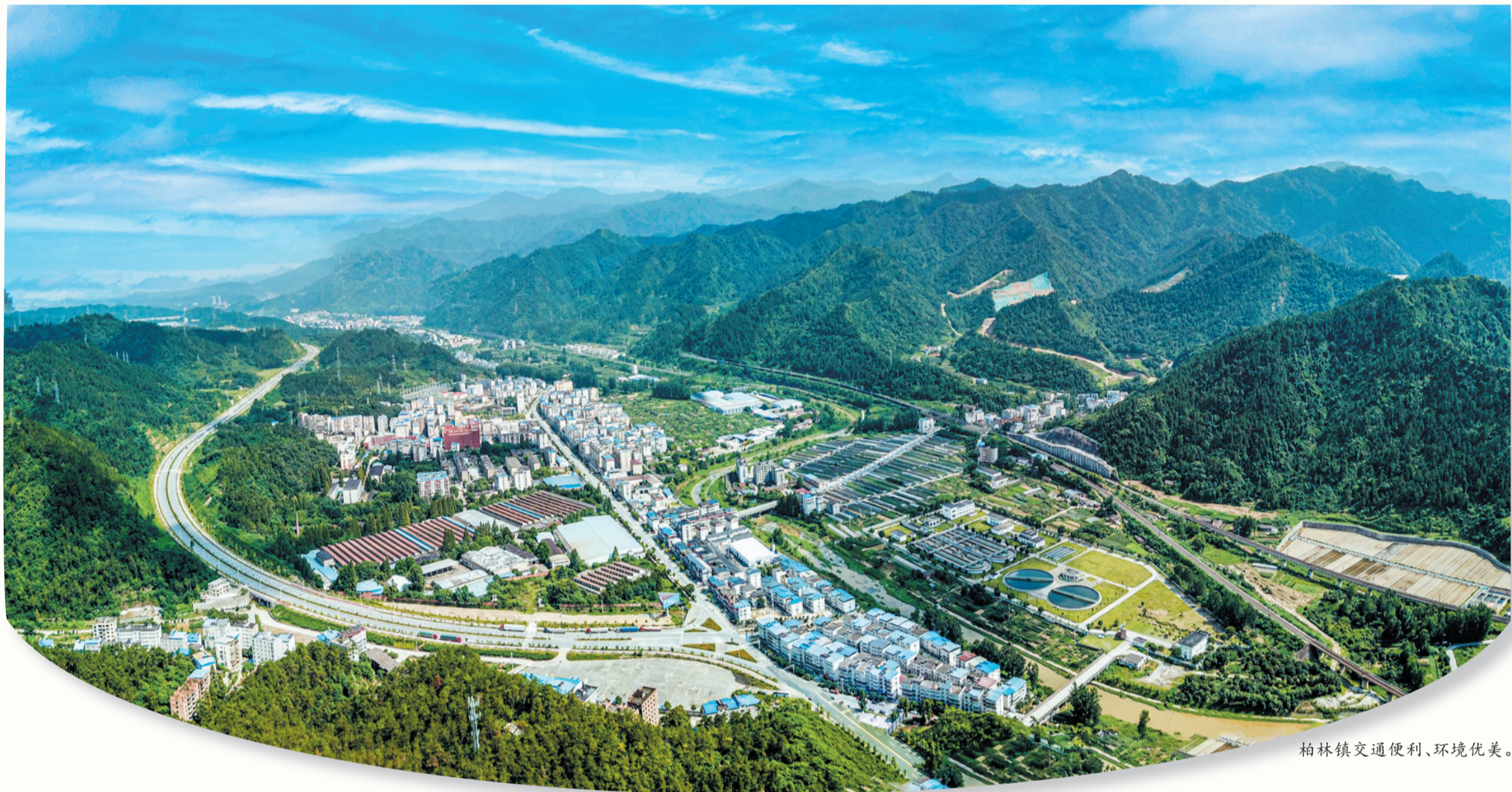
柏林镇交通便利、环境优美。

坐落于十堰城区西郊的柏林镇既是推进乡村振兴的主战场,也是提升城市能级的承载点。该镇以习近平总书记给十堰丹江口库区环保志愿者的重要回信精神为引领,将生态优先、绿色发展理念贯穿经济社会发展全过程,协同推进绿色项目攻坚、产业转型升级、美丽乡村蝶变,交出了一份满意答卷。今年上半年,该镇主要经济指标稳步达标,9个村(社区)被授予张湾区文明村(社区),其中白马山村获评“全国文明村”,知雨轩·别院民宿获评“全国甲级旅游民宿”。