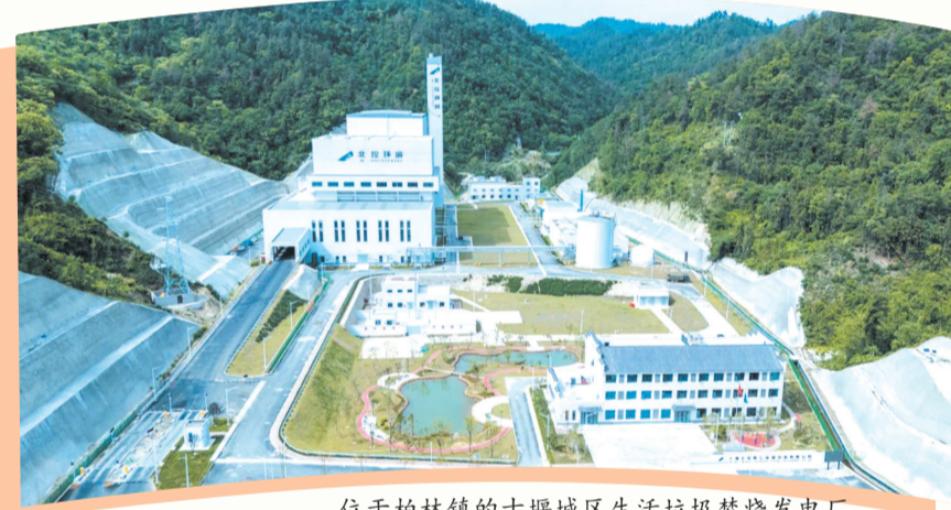
位于柏林镇的十堰城区生活垃圾焚烧发电厂。

逐绿而行,点“绿”成金。如今,漫步柏林镇,一幅生态与经济协同发展的美丽画卷正在徐徐展开。从垃圾焚烧发电到绿色环保项目招引,从环境综合治理到生态旅游崛起,这个城郊小镇用创新实践诠释着“绿水青山就是金山银山”的深刻内涵。