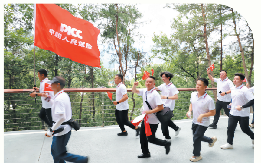
开展全国保险公众宣传日健康跑活动。

在服务国家战略中彰显担当,在保障民生福祉中践行初心。今年以来,人保财险十堰分公司坚持把“国之大者”牢记于心,将“民之盼者”落实于行,在服务绿色转型、维护社会和谐、保障民生福祉等领域勇担社会责任,为助力地方经济社会发展贡献力量。