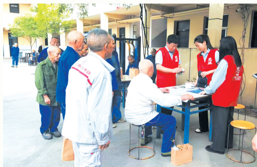
开展惠民志愿服务。