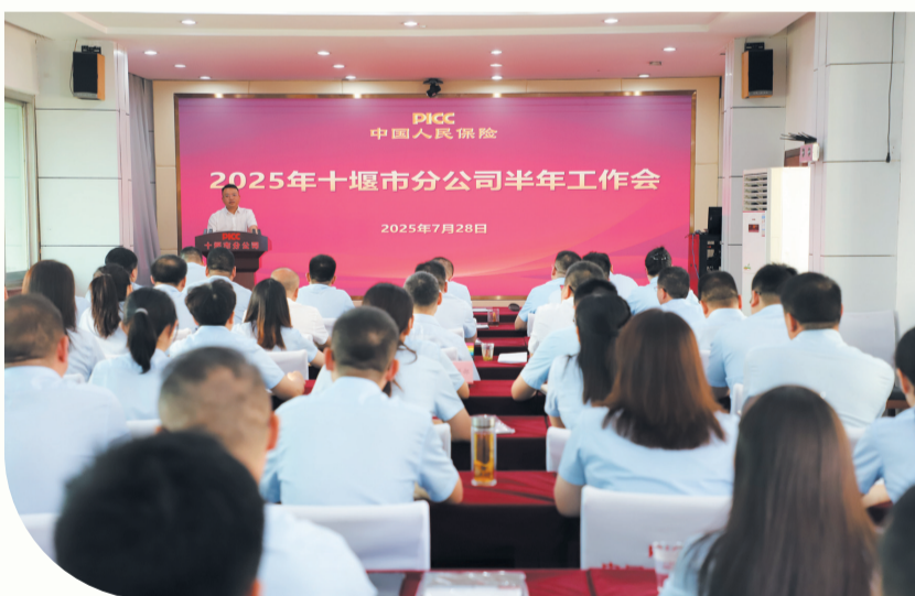
人保财险十堰分公司2025年上半年工作会。