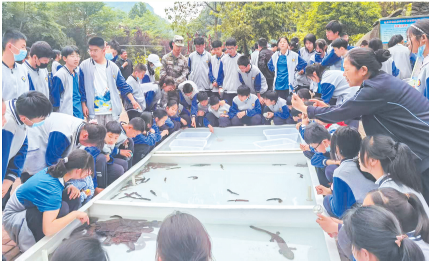
茅箭区汉泽农业生态研学现场。