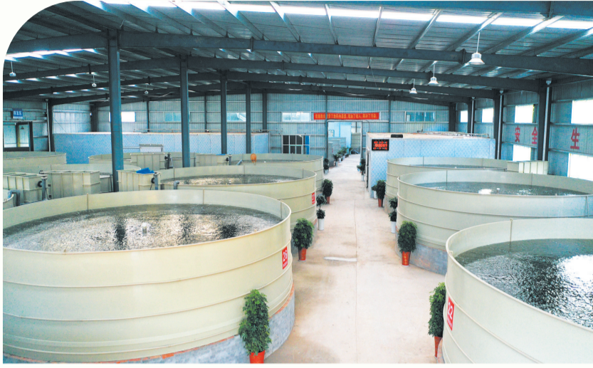
丹江口市均县镇奔富设施渔业基地。