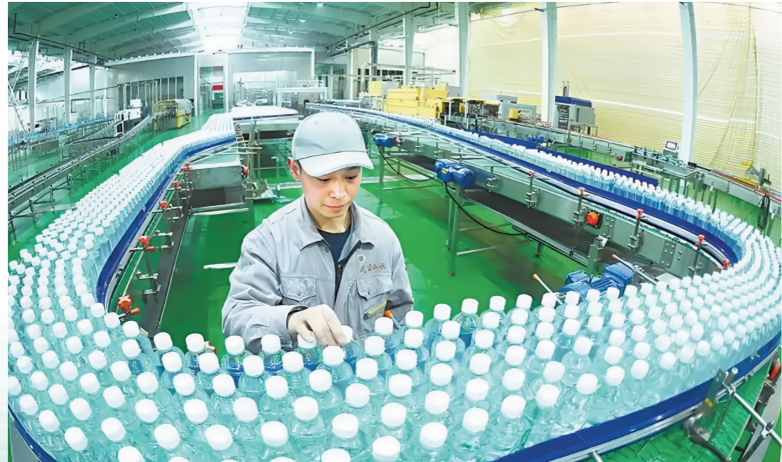
十堰用生态好水激活“经济活水”,2024年水经济综合产值突破400亿元。