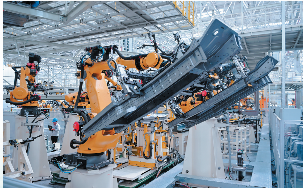
东风商用车有限公司车身智能制造升级项目实现焊接、涂装两大核心环节100%自动化。

目前,全市绿色出行比例达到67.5%,新能源(清洁能源)公交车和出租车占比分别达到90%和96%,为城市绿色低碳发展增添强劲动力。