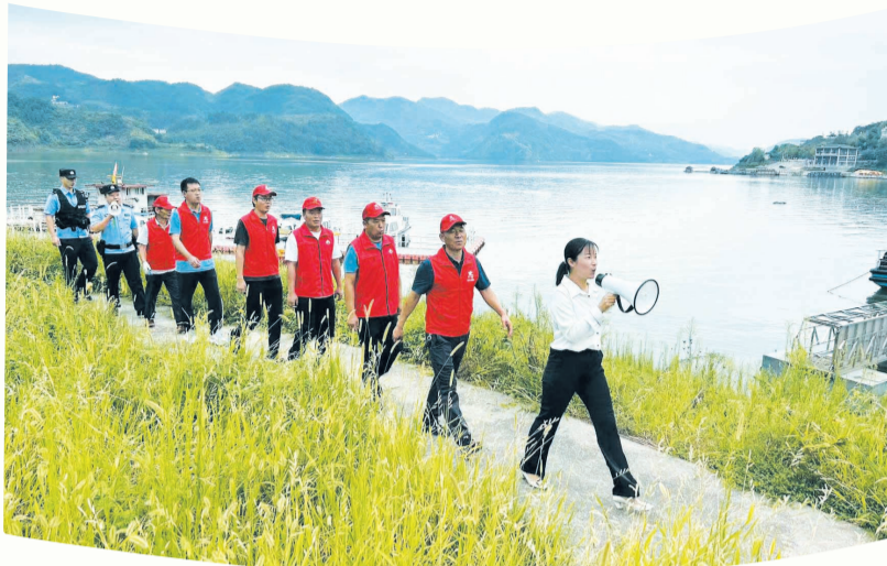
常态化开展守水护水志愿服务活动。