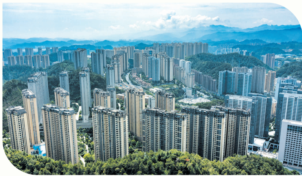
大美十堰。(资料图片)