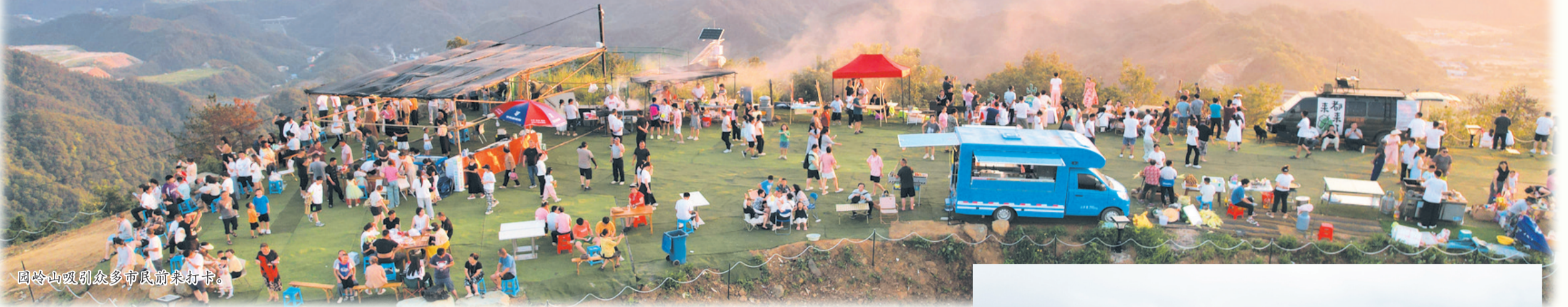
因岭山吸引众多市民前来打卡。

郧阳区青山镇东接丹江口市均县镇、六里坪镇,西邻茶店镇,南与十堰主城区接壤,北隔汉江与杨溪铺镇、安阳镇相望。镇域三面环水、一面临山,山水资源丰富,区位优势突出,是十堰主城区实施“东拓”“北扩”战略的重要组团之一。