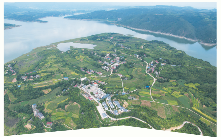
依山傍水的白果树村。

从“一处美”延伸到“一片美”,从“环境美”升级为“生活美”,青山镇12个行政村正以“六无乡镇”建设为笔,勾勒出新时代乡村振兴的生态画卷。这场绿色变革,不仅让乡村面貌焕然一新,更激活了乡村振兴的内生动力,让发展的活力在田野间持续涌动。