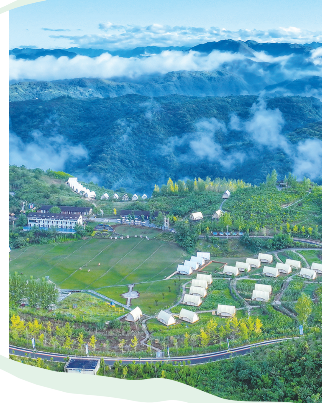
童话谷·天空牧场景区。

七夕临近，“中国七夕文化之乡”郧西县处处洋溢着浪漫喜庆的氛围；天河两岸灯火璀璨，喜鹊桥上人流如织，非遗展演接连上演，民宿客栈预订火爆，文旅市场持续升温……一场以“星河筑梦·家圆同心”为主题的文旅盛宴正渐入佳境。