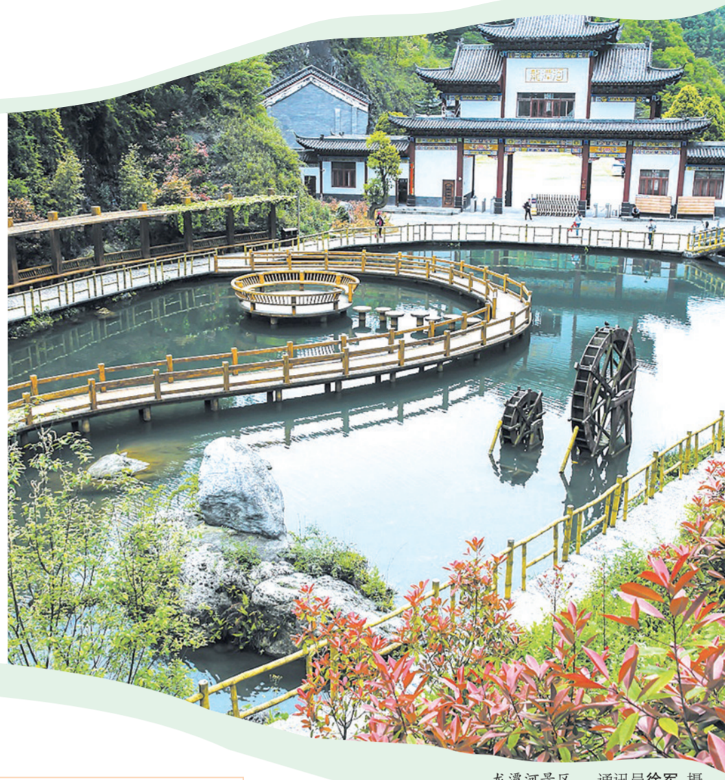
龙潭河景区。