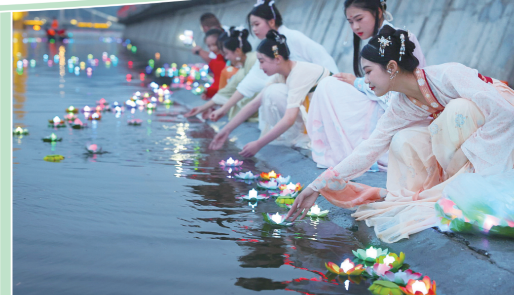
郧西七夕民俗放河灯。