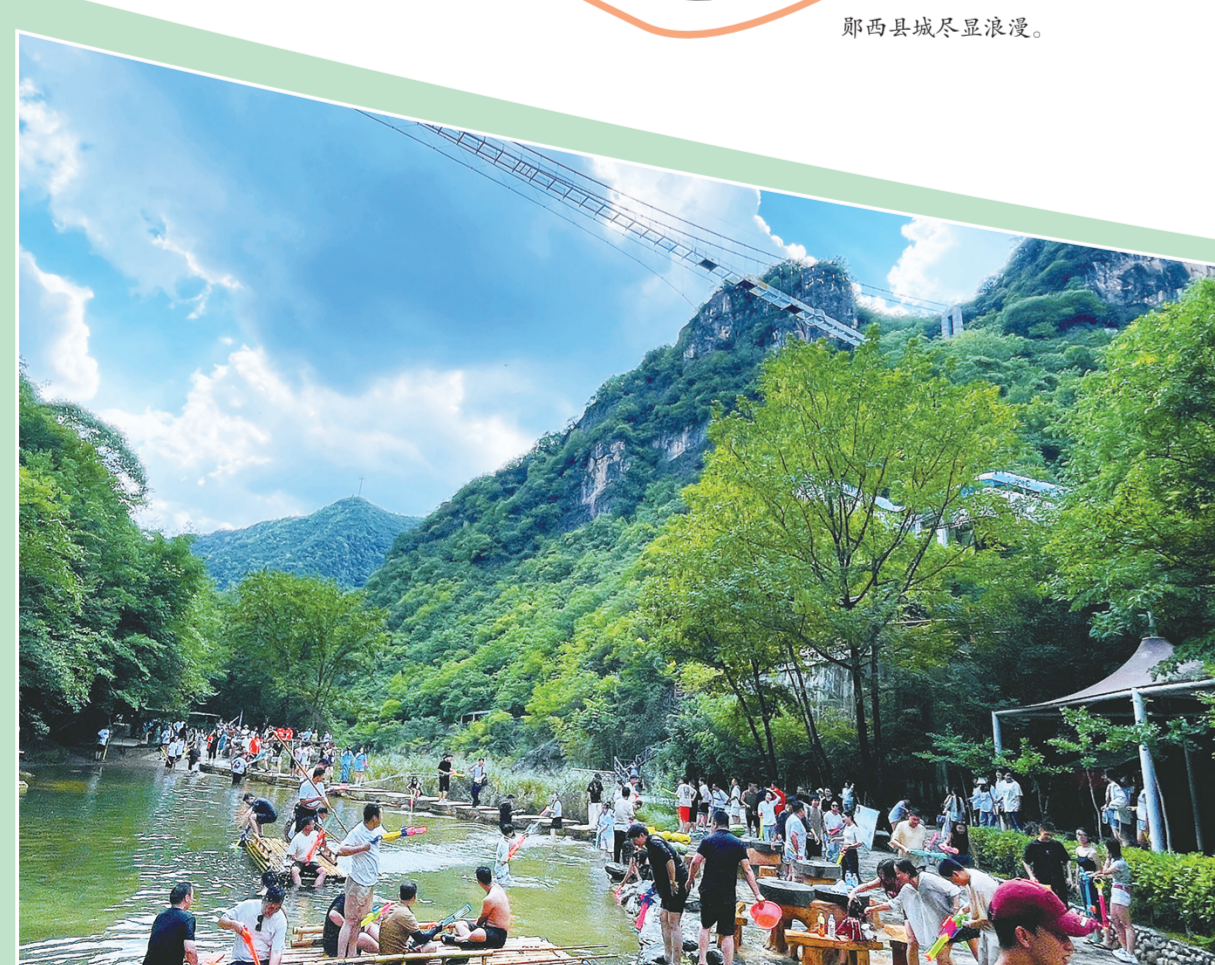
五龙河景区。

“我们特意从西安提前自驾过来，就为沉浸式体验郧西的七夕文化！”近日，一支由80余辆自驾车、384名游客组成的“走进西安最近的江南——郧西”自驾游，浩浩荡荡驶入郧西县。这是该县“百盟千团万人游郧西”系列文旅营销工程在自驾市场取得突破的生动写照，更多游客循着七夕之名，开启“山水田园·生态度假”之旅。 “这里的山水与七夕文化让人留恋，文创产品也丰富。”西安游客陈帆说，像他这样提前“赴七夕之约”的游客，在郧西随处可见。 “受七夕与暑期叠加效应影响，目前景区日均接待已超1500人次，已累计接待旅行团近百个。”五龙河景区工作人员肖燕介绍，“织女谷”景点最受青睐，游客在此沉浸式感受牛郎织女爱情传说，参与民俗互动、拍照打卡，现场欢声笑语不断。为应对客流高峰，景区增派人员，强化安全保障，还推出七夕祈福、篝火晚会等特色活动，全方位提升游客体验、烘托节日氛围。 景区人潮涌动，夜市烟火正浓。华灯初上，小河夜市人声鼎沸，烤串与地方小吃的香气四处弥漫，吸引游客驻足品尝。 “最近每晚都要多备食材，有时一晚就能卖出5000多元。”烧烤摊主彭小莲一边熟练翻动烤架上的羊肉串，一边笑着说。夜市里，烤串的滋滋声与人们的欢声笑语交织，让郧西的夜晚更具“烟火气”。 老北街低密度文化街区同样热闹非凡，非遗三弦馆里琴声悠扬，地道羊肉汤馆“大唐名羊”座无虚席，游客在古风氛围中品味美食、欣赏表演，文化、旅游与商业深度融合的街区持续点燃消费热情，郧西正以多元“夜经济”场景，将节日“流量”转化为游客“留量”。 今年以来，该县深入挖掘、活化利用七夕文化宝贵资源，创新实施“西引力”工程，推动文旅深度融合。数据显示，前5个月全县接待游客人数同比增长25.08%，旅游收入同比增长26.47%，市场活力显著增强。 通过“活动+景观+演绎”三位一体模式，该县全方位展现七夕文化魅力，让游客踏入县城便沉浸于浓郁节日氛围。该县将七夕元素融入城市建设，已建成文化景观29座、七夕广场、喜鹊长廊等特色景观；培育网红经济集聚区16个、精品民宿2600余间，持续做强“烟火气”，研发“七喜人生”文创、科创、文创系列产品1000余种，带动110余家文化企业发展，农特产品销售额达1.45亿元。 近年来，郧西县着力打造“天上七夕·人间郧西”“天子渡口·古寨上津”两大文旅品牌，建成14家A级旅游景区，先后荣获“国家生态文明建设示范区”等多项称号。与此同时，该县以“以文招商”为抓手，每年吸引数亿元项目投资，奥维工业、中康电力、城友智慧农业等一批生态文旅康养、新能源汽车智能制造、绿色有机农产品加工企业相继落户，为县域经济高质量发展注入新动能。