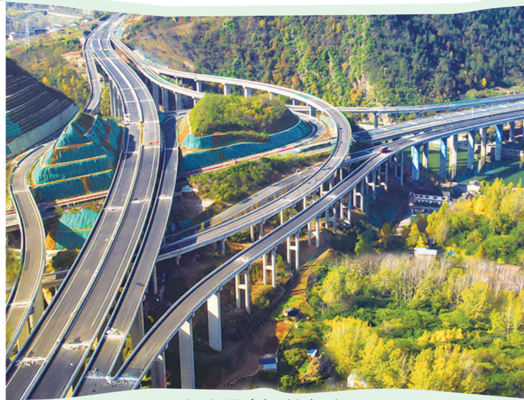
十巫北、福银高速公路绕城而过。