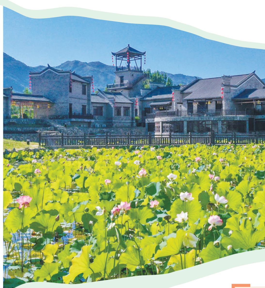
上海道民俗“荷”你有约。