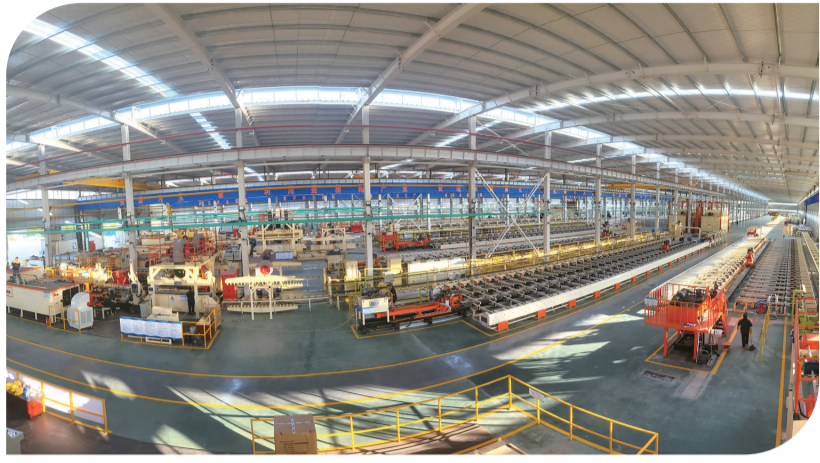
湖北天为铝业科技有限公司对再生铝进行加工。