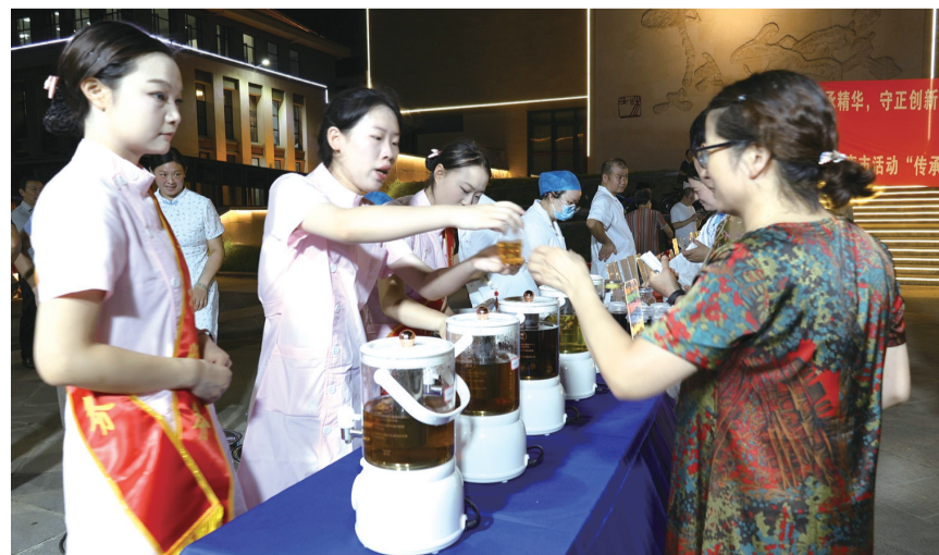
提供特色中药茶饮,同步讲解各类膏方丸剂等的功效与适用人群。此外,现场

活动现场设置地道药材展示、养生茶饮品鉴、中药制剂展示、传统理疗体验、义诊服务及八段锦、太极拳教学六大区域。在义诊服务区,来自6个科室的资深中医专家通过中医脉诊、体质辨识等传统诊疗手段,结合现代医学检查,为市民制订个性化养生指导方案。传统理疗体验区提供针灸、艾灸、推拿等特色项目,市民可免费体验。养生茶饮品鉴区