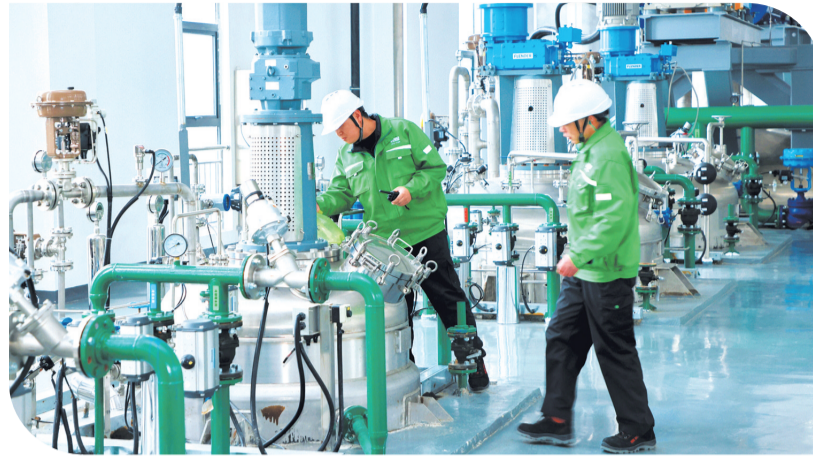
技术人员在合成生物创新项目生产车间检查机器运行情况。

8月28日,房县北城工业园新能源电池拆解产业园项目建设现场如火如荼。这个刚刚建成的项目已有6个厂房正式投产。该项目的建成投产有效推动房县新能源电池回收利用产业规模化发展,加速构建绿色低碳循环经济体系,为区域经济社会全面绿色转型注入强劲动能。