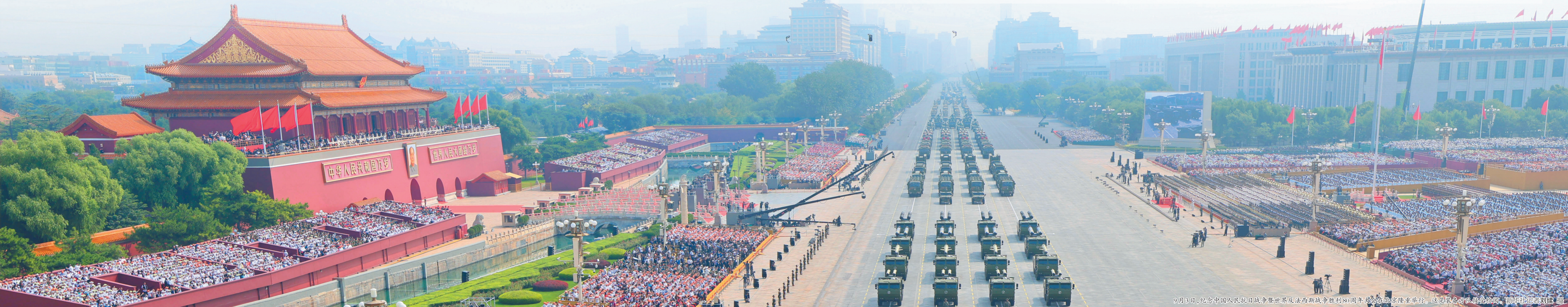
9月3日,纪念中国人民抗日战争暨世界反法西斯战争胜利80周年大会在北京隆重举行。这是受阅部队检阅方阵。