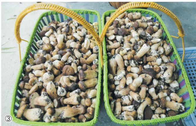
①雨后,村民收获满满一篮野生菌。②刚冒出地表的牛肝菌。③村民送到菌菇交易中心的新鲜野生牛肝菌。