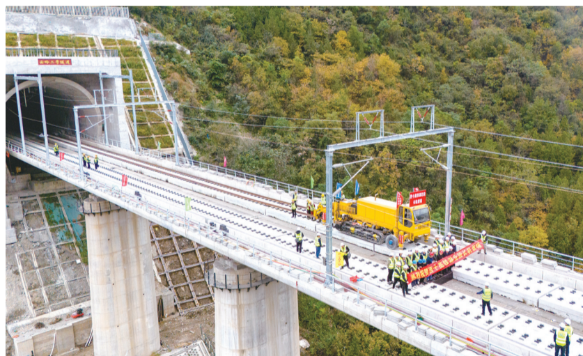
10月31日,西十高铁湖北段开始铺轨。

本报讯 记者段吉雄 通讯员杨林报道:10月31日上午,西十高铁湖北段铺轨工程在鄂陕交界处的云岭一号隧道正式启动。随着现场指令下达,牵引车拖拽两根各500米长的钢轨跨