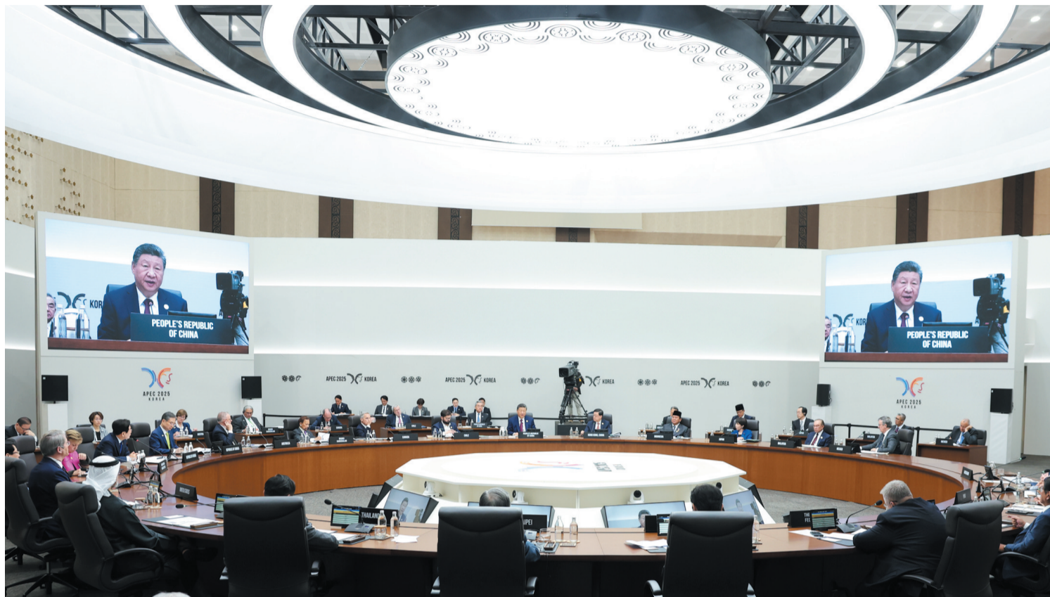
当地时间10月31日上午,国家主席习近平出席亚太经合组织第三十二次领导人非正式会议第一阶段会议,并发表题为《共建普惠包容的开放型亚太经济》的重要讲话。