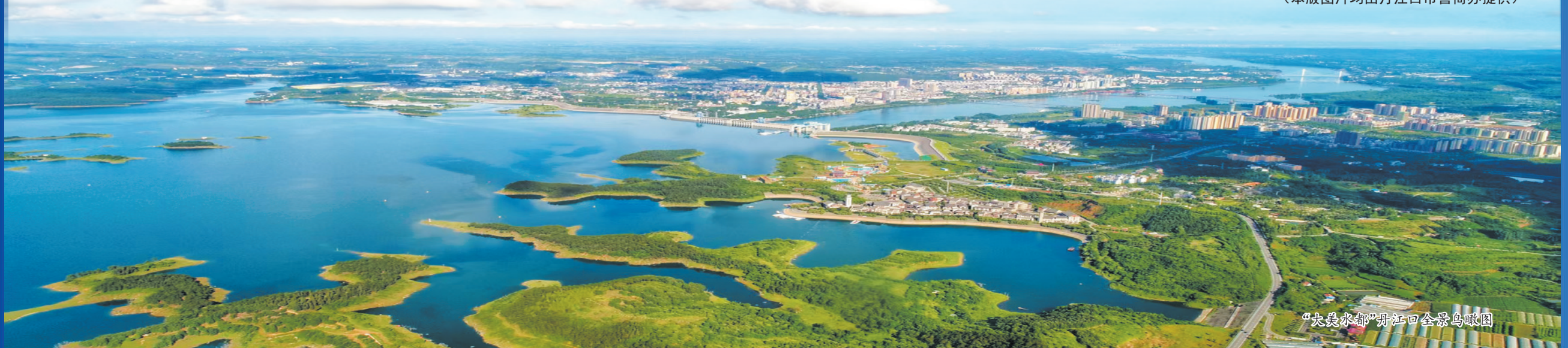
“大堰之都”丹江口全景鸟瞰图