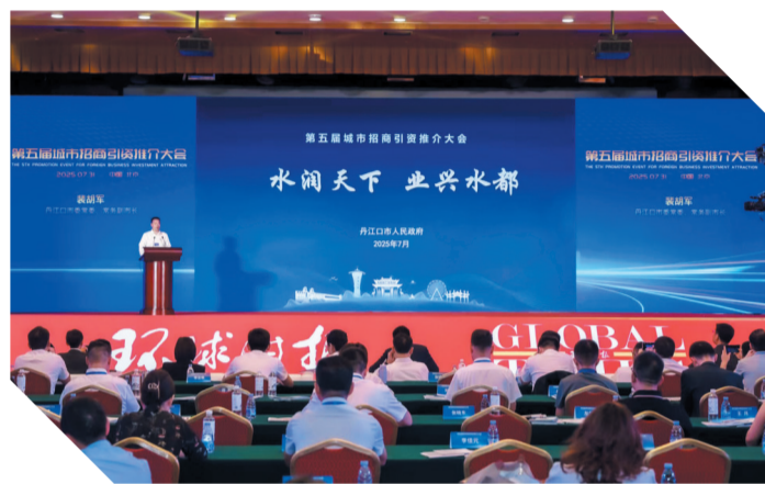
第五届城市招商引资推介大会会场