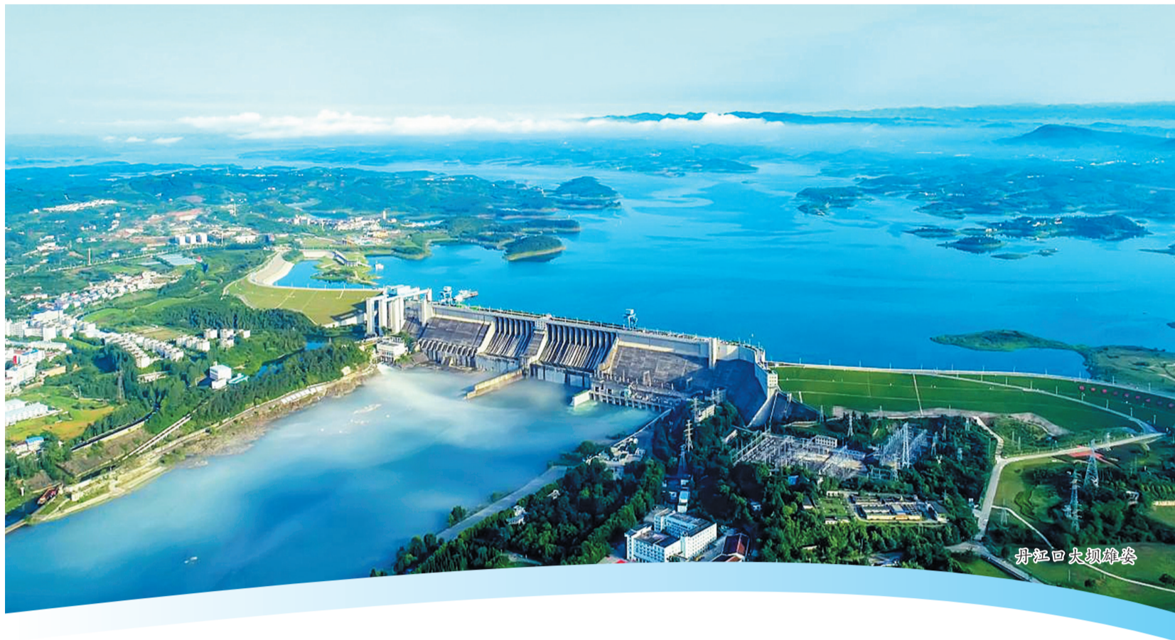
丹江口大坝鸟瞰图

作为南水北调中线工程核心水源地,丹江口市在推进高水平生态保护的同时,始终将优化营商环境作为高质量发展的重要抓手,有效推动生态优势向发展动能转化,确保政策红利精准直达企业。该市39项改革成果获得省委、省政府表彰肯定,营商环境评价位列全省前十,获评“2024年中国高质量发展营商环境最佳县(市)”,跻身全国“中部百强县”行列。