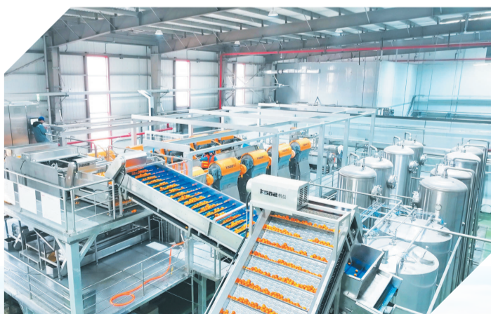
北冰洋橘汁汽水生产线