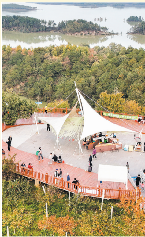
一年好景君须记,最是橙黄橘绿时。摄于丹江口市千岛画廊。