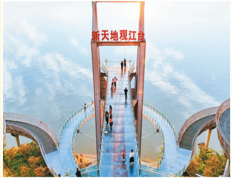
步道如银练蜿蜒,江水似蓝绸铺展。摄于鄢阳区新天地观江台。