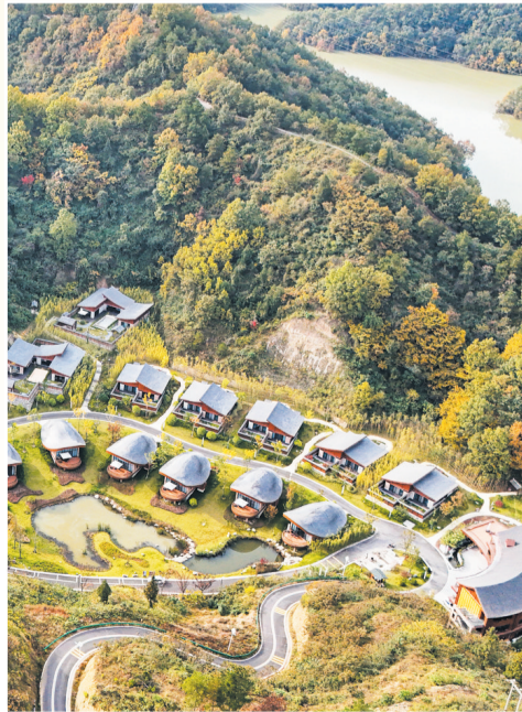
远村秋色如画,红树间疏黄。摄于武当山特区太极湖旁民宿群。