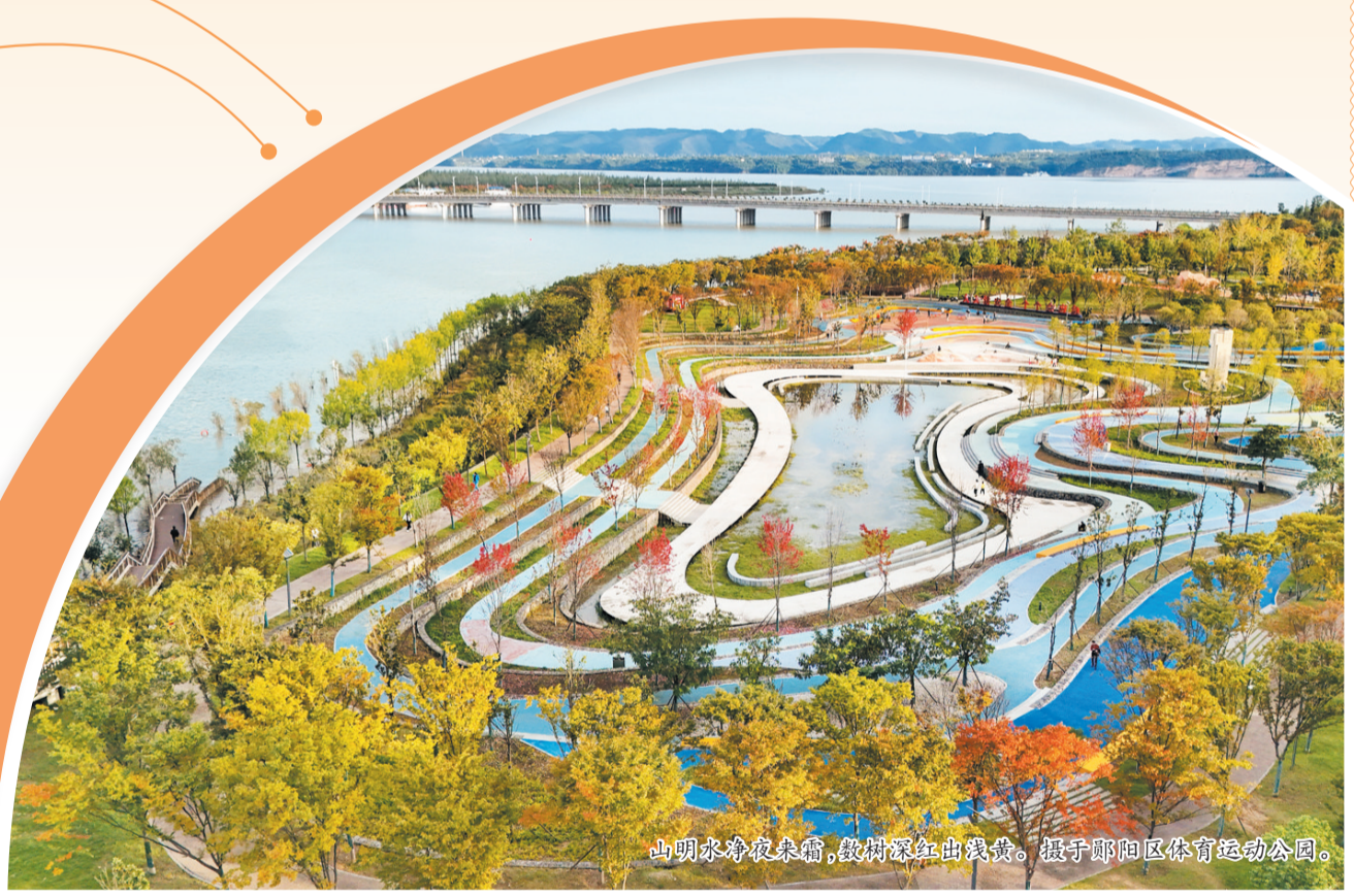
山明水净夜来霜,数树深红出浅黄。摄于鄢阳区体育运动公园。