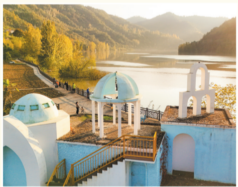
青山隐隐水迢迢,秋尽江南草未凋。摄于张湾区方滩乡沉潭河村。