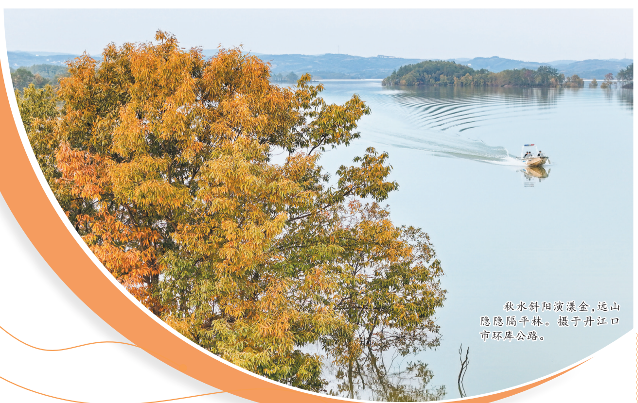
秋水斜阳演漾金,远山隐隐隔平林。摄于丹江口市环库公路。