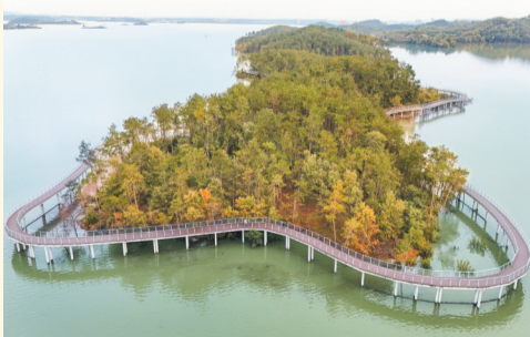
一岛葱茏水畔环,长桥宛转卧波间。摄于丹江口市如意岛。