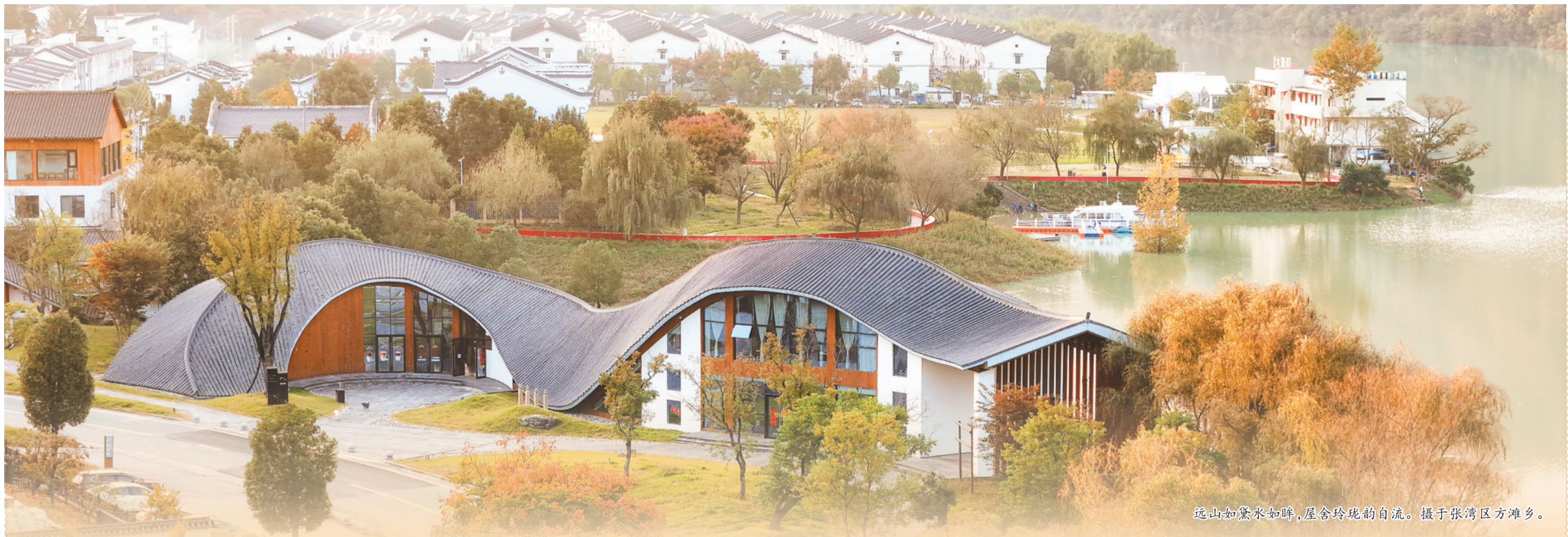
远山如黛水如眸,屋舍玲珑的自流。摄于张湾区方滩乡。