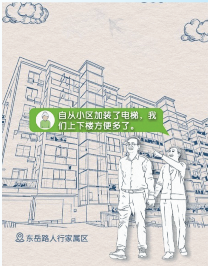
图3:通过AI视频生成技术,让画面变得更加生动。

重大主题报道是党和政府宣传工作的重要载体,更是新媒体报道的主战场。如何以小切口呈现重大主题、以新创意实现硬新闻“软”着陆,是十堰晚报·秦楚网微信编辑部始终深耕的课题。生动新颖的海报、SVG、H5等表现形式常被作为首选,但实际操作中却难题频现——画面质感不足、制作周期冗长。