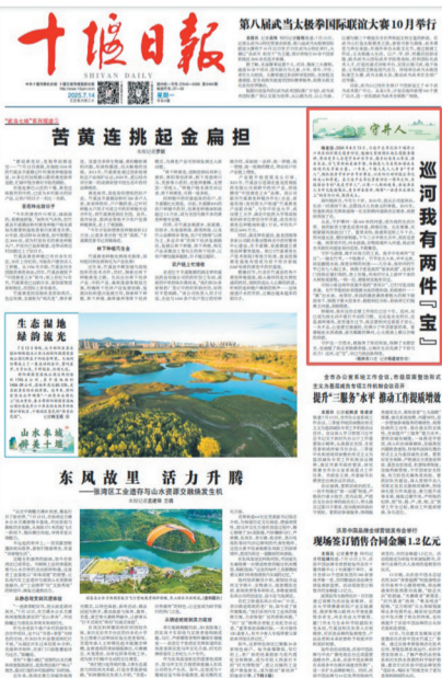
2025年7月14日起,《十堰日报》1版开设《我是守井人》专栏。

新闻专栏是现代媒体的重要组成部分,打造优质新闻专栏,能显著提升媒体的知名度与美誉度。作为地方主流媒体,《十堰日报》始终非常重视打造名优专栏,其中《我的扶贫故事》专栏曾斩获湖北新闻一等奖,《乡村振兴故事》专栏持续刊发四年,《现场短新闻》专栏也已开设两年有余,均取得了良好社会传播效果。翻阅近期《十堰日报》可见,该报从7月14日起在头版开设《我是守井人》专栏,截至目前已刊发近30期。细品专栏内容不难发现,这是《十堰日报》精心策划、匠心打磨的又一独具本土特质的精品新闻专栏。