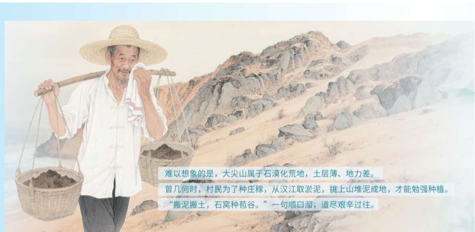
图1:编辑利用AI,用时不到两分钟制作的老人形象。