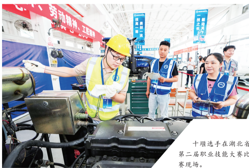
十堰选手在湖北省第二届职业技能大赛比赛现场。

2025年,市人社部门坚持“抓创业促就业”,扎实推进以乡情为纽带的外出务工人员返乡创业,联合财政、税务、人行等部门出台一揽子返乡创业政策措施,发布农业、林下经济、文旅康养等十大返乡创业产业领域清单,强化政策支持体系。搭建“种子+孵化器+创业园”孵化体系,新增省级“荆楚返乡创业园”1个、“荆楚归雁项目”5个。赴深圳开展“乐业十堰·创赢未来”返乡创业推介活动,组织“共话乡情”等返乡创业座谈交流135场,广泛对接有返乡创业意愿的外企业家、能人,推介优质创业项目,全市新增返乡创业8756人,带动就业2.6万人,产业带动和就业倍增效益显著。