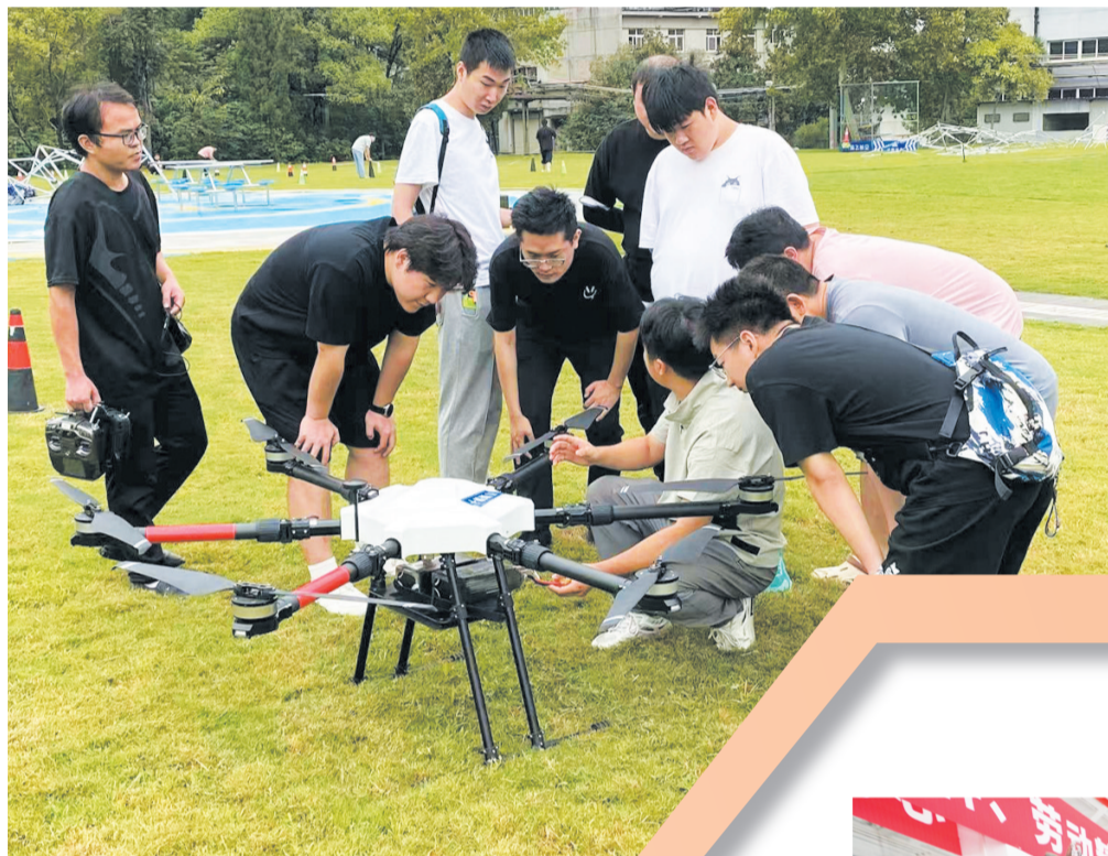
市人社局组织开展无人机驾驶员技能培训。