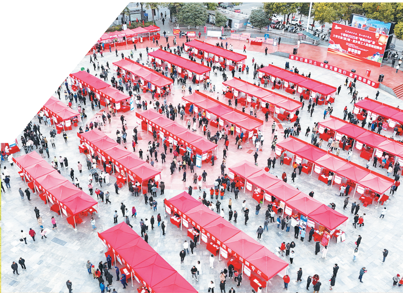
2025年“春风行动”暨大学生留(回)堰·返乡能人现场招聘会。

就业是民生之本,人才是发展之基。2025年,市人社局紧紧围绕市委、市政府中心工作,聚焦聚力支点建设,以加强人力资源开发利用为主线,统筹推进稳就业、引人才、促发展、兜底线等各项工作,交出了一份沉甸甸、暖融融的民生答卷。一组组跃动的数据,一项项创新的举措,一个个鲜活的故事,共同勾勒出十堰人社事业高质量发展的生动图景。