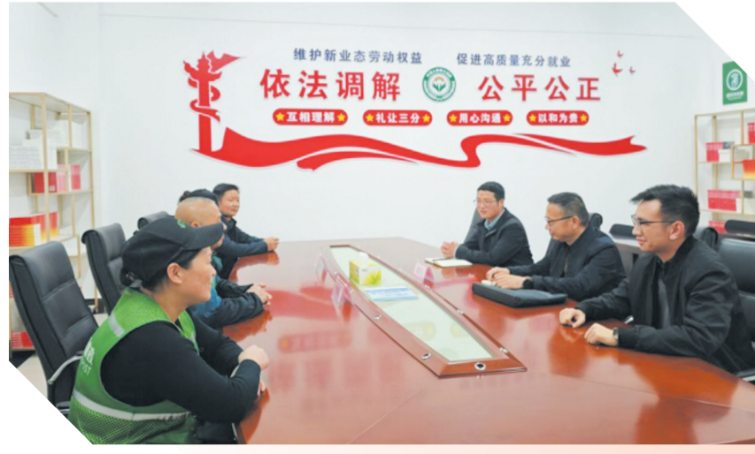
基层调解组织化解矛盾纠纷。