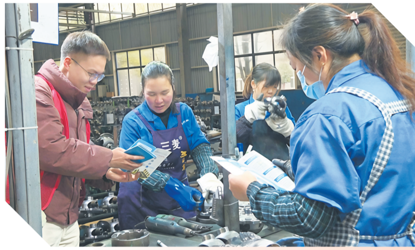
组织志愿者深入企业宣传社保政策。