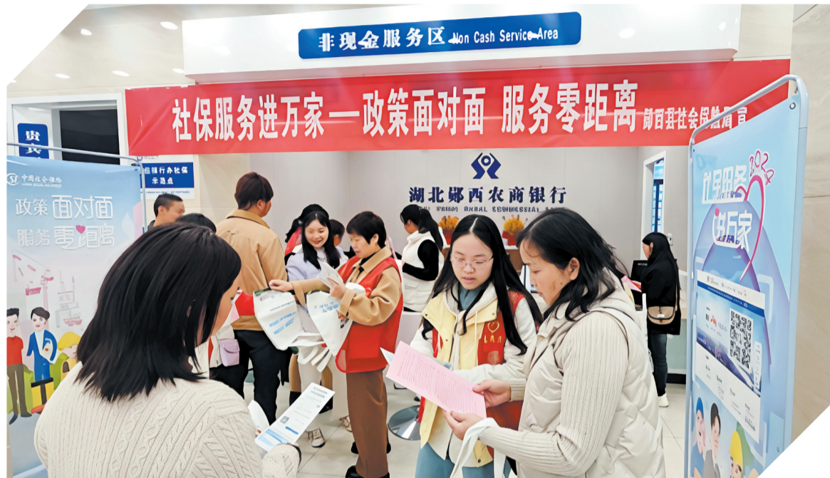
开展“政策面对面,服务零距离”社保服务进万家活动。

秦巴巍峨,天河迤迤,郧西大地之上,“服务支点、建功支点”的澎湃浪潮持续涌动,“推动二次创业”的磅礴动能愈发强劲。