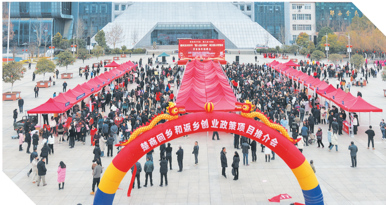
举办能人返乡创业项目推介暨鄂州-郧西劳务协作招聘会。