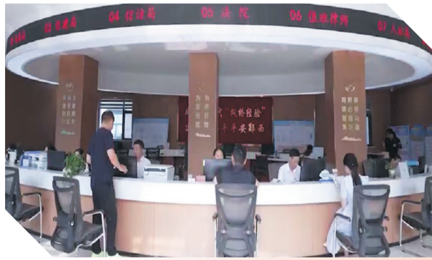
“人社+工会+N”劳动人事争议一站式服务窗口。

创新机制,激发人才“新活力”。深化事业单位人事制度改革,重点抓实岗位设置、人员聘用、严格考核三项核心工作,推动人事管理规范化、科学化。探索灵活用人模式,为企业引进高技能人才1100人次,助力企业转型升级。农村实用人才培育经验入选2024年湖北省农民合作社培育典型案例,人才对乡村振兴的支撑作用愈发凸显。