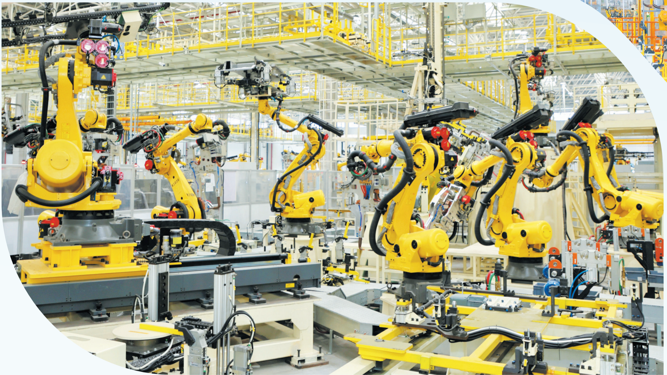
东风商用车D600智慧工厂正式投产。

1月24日,茅箭区东城经济开发区东风商用车D600智慧工厂内,288台工业机器人伸展机械臂,在焊装、涂装、装配三大车间精准“舞动”,科技感扑面而来。