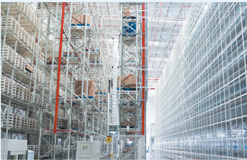
立体物流让生产效率达到行业领先水平。