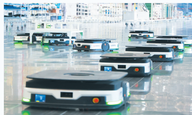
AGV自动导引运输车让制造过程更加高效。