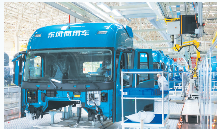
集绿色、智能于一体的装配车间。