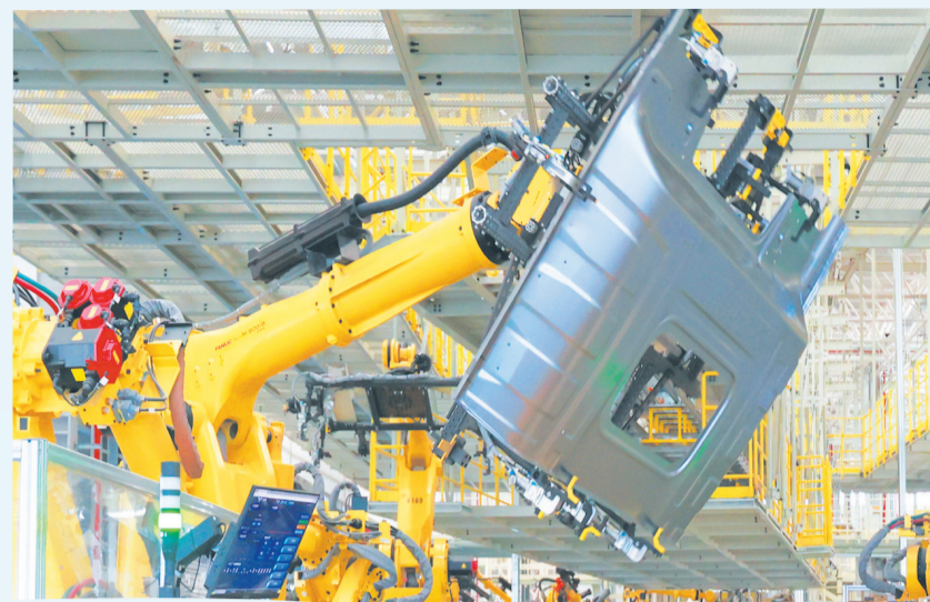
焊装车间自动化率达100%。