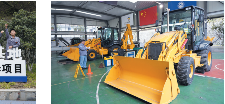
第46届世界技能大赛重型车辆维修项目中国集训队在湖北东风汽车技师学院集训。

上的概念，而是融入办学基因的日常实践。企业生产线是最真实的课堂，行业技术难题是最鲜活的教材。学生面对的不只是教学设备，更是市场上最前沿的车型和最真实的故障案例。从东风商用车最新的国六发动机，到各类进口重卡的复杂电控系统，学生在校期间就已反复拆解、诊断、修复。这种与产业一线“零距离”对接的环境，为重型车辆维修这类高度复杂、实践性极强的项目，提供了无可替代的孵化土壤。