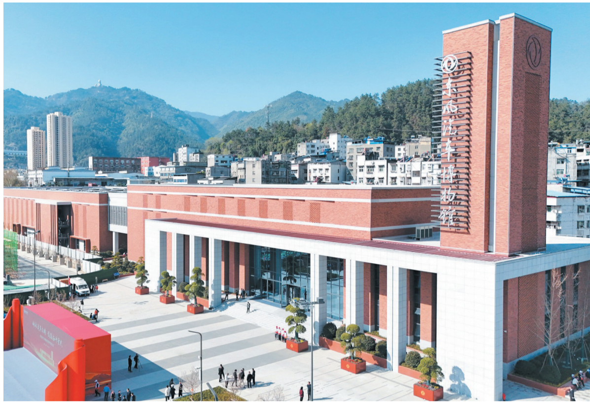
东风汽车博物馆(资料图片)