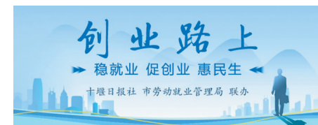
十堰日报 市劳动就业管理局 联合

谋三园践行着自己的初心,常对团队伙伴说:“平台拼的不是规模,而是百姓的真心认可;做的不是生意,而是细水长流的民生服务。”如今,谋三园步履不停,心中有着更长远的规划:继续向其他区域拓展服务,让“家事速配”走进更多街巷小区;深化本地供应链,对接更多优质商户和农户,丰富平台供给,让居民的生活更便利;同时,带动更多返乡青年加入,一起创业,反哺家乡,让更多人实现灵活就业。