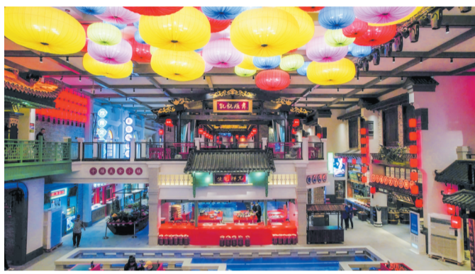
现象级餐饮地标——“农耕二张烙馍村”(资料图片)

沉寂多年的旧车间变身网红餐厅，老职工生活区的青石板路上，游客在镶嵌着马灯、旧风扇的“情怀地标”前打卡拍照……走进初春的十堰，工业记忆与现代生活交融的场景随处可见。