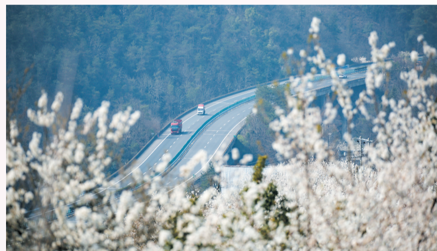
盛开的樱桃花掩映高速公路。