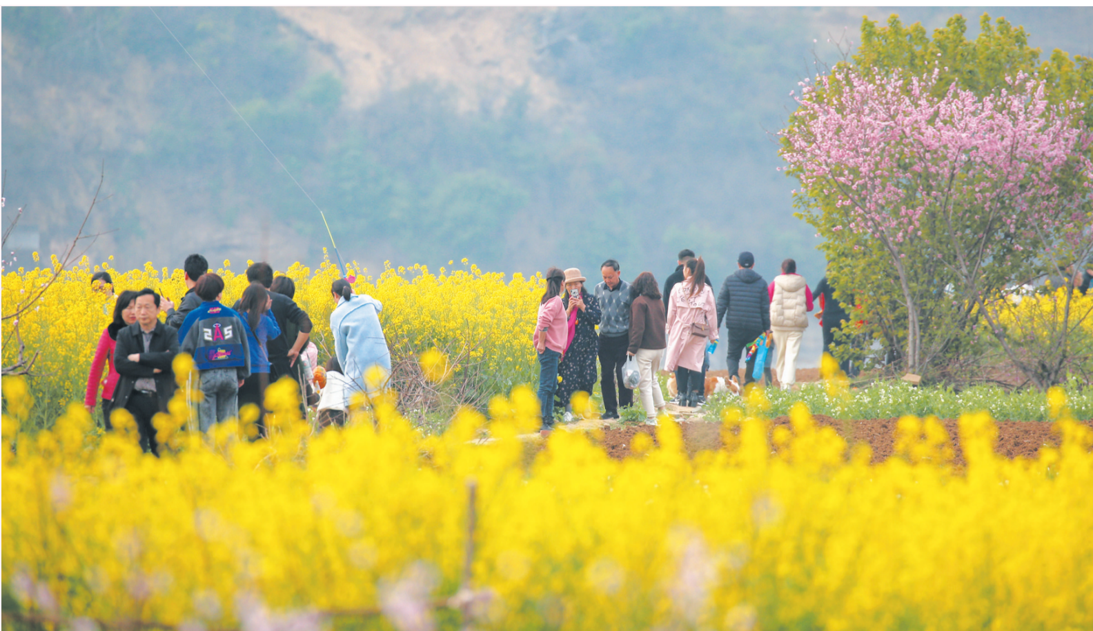
游人穿行在油菜花海中。

春风拂过汉江,将鄂西北山城十堰晕染成一幅流动的春日画卷。从郧西江畔的金黄花浪到房县山间的粉白云霞,从街巷里的梅香长廊到园林中的繁花胜景,春日车城处处诗意盎然,市民徜徉花海,尽享惬意时光。