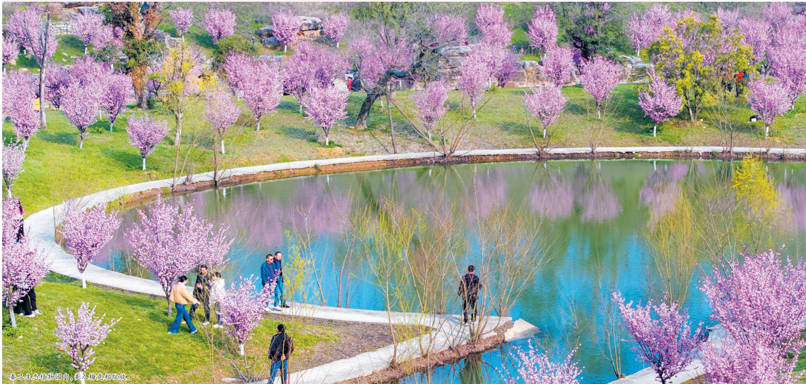
秦巴生态植物园内,美人梅竞相绽放。