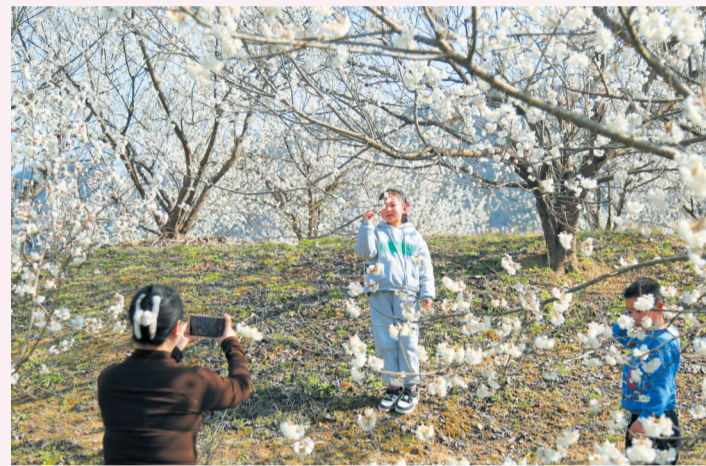
游客在樱花树下拍照留念。