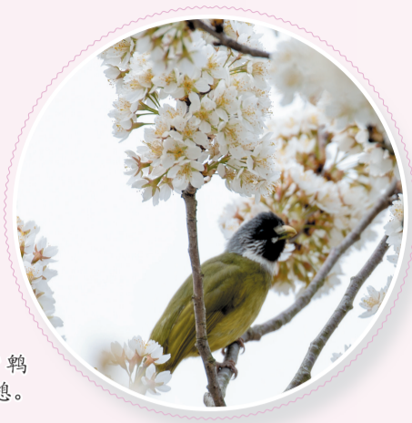
领雀嘴鹀在花枝中小憩。