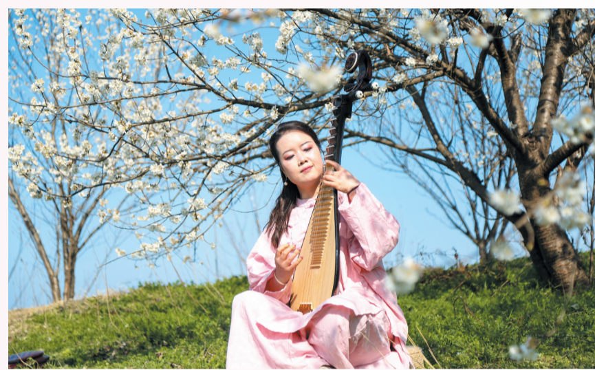
指尖轻触弦柱,似将春日絮语揉进乐声。

从江畔到山间,从街巷到园林,金黄与粉白交织,山水与人间共情。十堰的春日,是花与江的相拥,是市民与春光的相逢。春风拂过,花浪起伏,车城在缕缕花香里,绽放成最动人的模样。