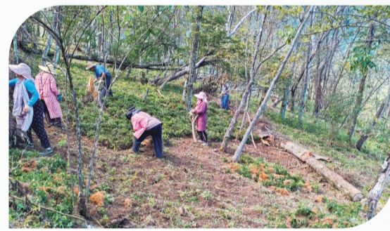
药农抢抓时节采挖黄莲。