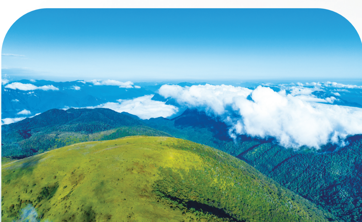
湖北十八里长峡国家级自然保护区内高山草甸与原始森林。

改革,是破解难题的钥匙,更是激发活力的引擎。2025年,我市获得国家级、省级林业改革试点数量位居全省第一。