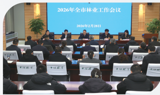
2026年全市林业工作会议召开。

据统计,林下经济已覆盖全市100多个乡镇、700多个村,参与农户69万人,户均年增收1.8万元,农民收入的40%左右来自林下经济。全市林业产值达73.4亿元,占农业总产值的17.1%。