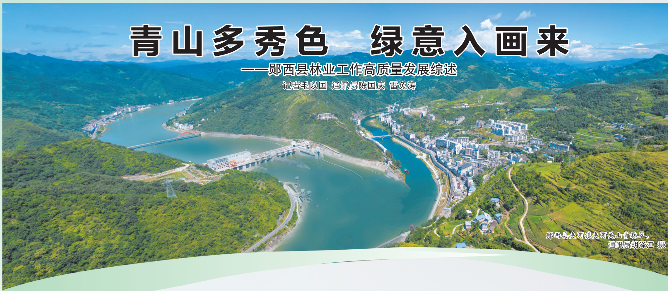
郧西县夹河镇夹河关山青林翠。

秦岭南麓街绿意,天河之滨起芳华。在郧西这片坐拥430万余亩林地的沃土上,林业人以“三绿”为笔、“四库”为墨,绘就一幅“绿染山川、管护有力、产业兴农”的生态画卷。2025年,郧西县成功获评全省优化营商环境林权信息管理与不动产登记互通共享试点县,羊尾镇林长制实践入选国家林草局“两山”转化典型案例,县林业局被市林业局授予国土绿化、自然保护地建设、野生动植物保护、森林防火先进单位……一项项荣誉,正是郧西县林业事业高质量发展的生动注脚。