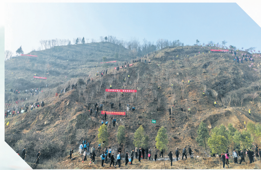
义务植树给山体披绿装。