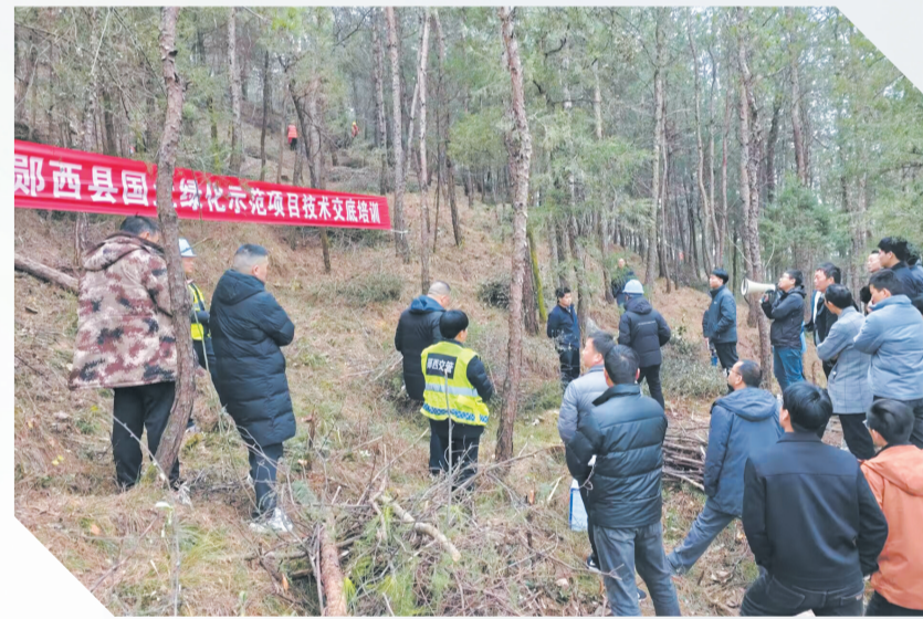
国土绿化示范项目技术培训现场。