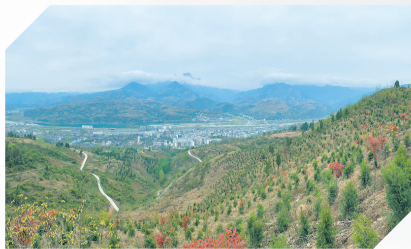
群山环抱的郧西县上津镇。

从漫山遍野的盎然新绿,到坚不可摧的资源防线,再到富民兴村的特色产业,郧西县林业人以汗水与智慧,在秦巴山区奏响“绿水青山就是金山银山”的生动乐章。站在“十五五”开局新起点,郧西县将继续在秦巴山麓深耕绿色发展、在汉江河畔坚守生态底线,让每一片山林成为百姓的“幸福不动产”,让每一缕绿色化作乡村振兴的新动能。