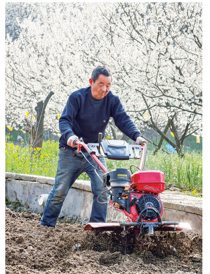
张湾区汉江路街道柳家河村,村民抢抓晴好天气翻整土地。