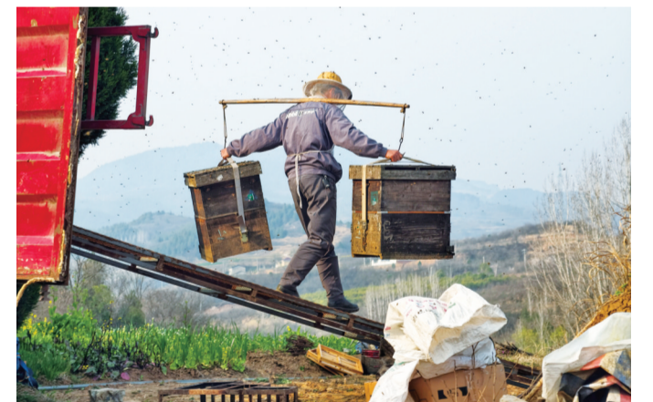
丹江口市习家店镇乡村公路旁,养蜂人挑着蜂箱来到田间。成群的蜜蜂在花间飞舞,酿出春日甜蜜的希望。