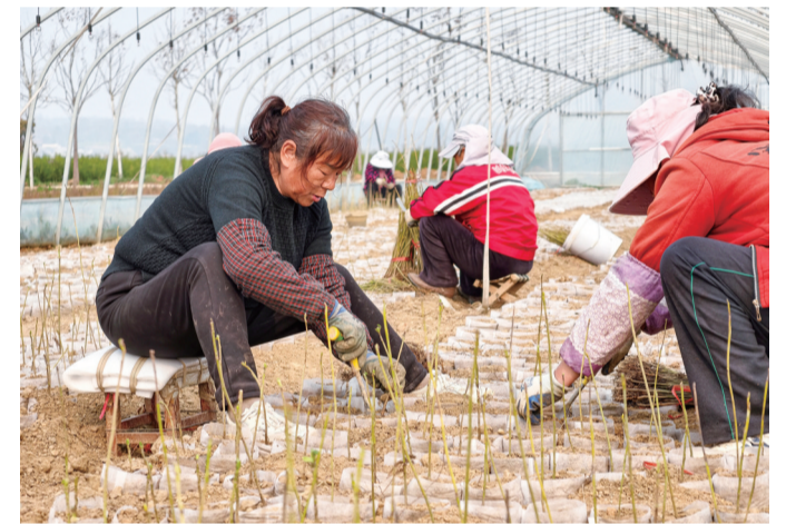
位于郧阳区汉江边的十堰绿鑫林业发展有限公司兴盛苗木繁育基地,农民在移栽林木幼苗。

人勤春来早,沃土孕生机。漫步阡陌间,每一寸土地都悄然苏醒,每一份劳作都孕育着希望。忙碌的身影、葱郁的田野、涌动的生机,构成春日里最动人的风景,诉说着秦巴儿女对土地的深沉热爱,寄托着对五谷丰登的美好期盼。