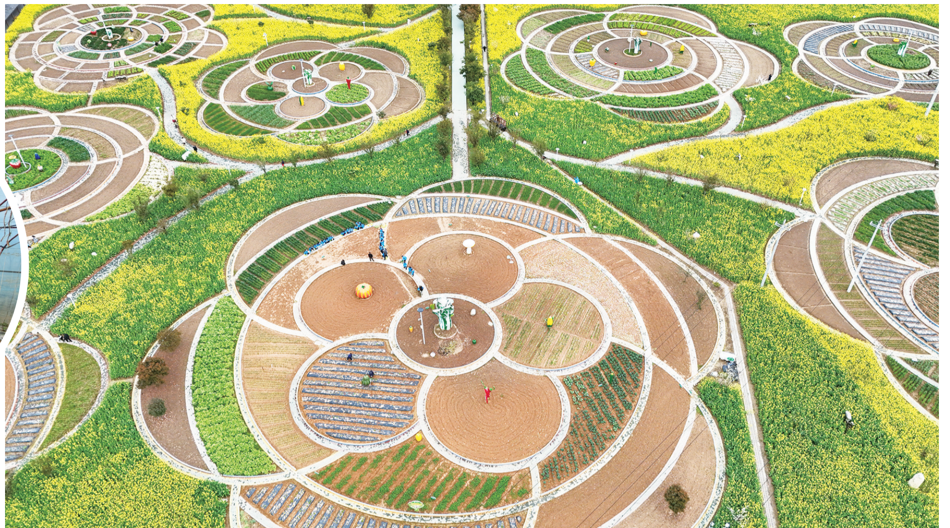
张湾区柏林镇知雨轩·田园综合体绿意盎然,生机勃勃。