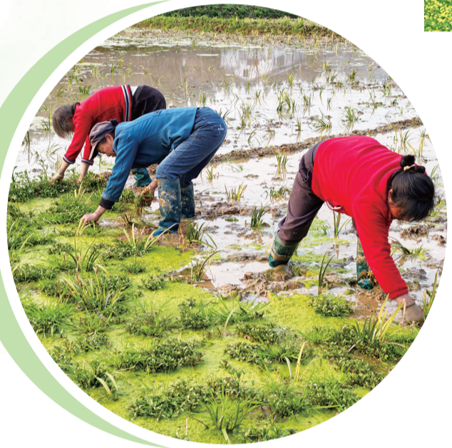
郧阳区安山镇,农户们在水田中为种植的中药材除草。