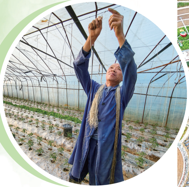
郧阳区柳陂镇沙洲村蔬菜大棚里,菜农为西红柿吊绳拉秧。