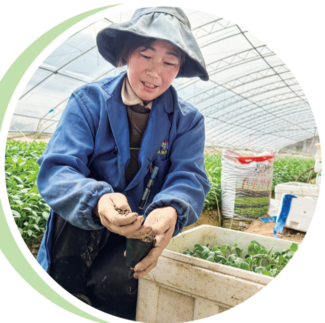
张湾区柏林镇柏林村蔬菜育苗基地,菜农精心管护蔬菜种苗。