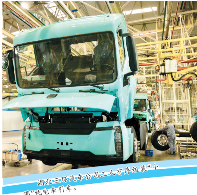
湖北三环汽车公司工人有序组装“小满”纯电牵引车。