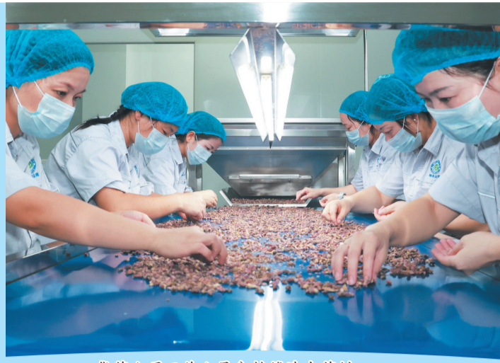
华药公司工作人员分拣筛选中药材。