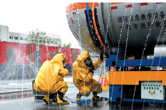
危化品泄露处置科目协同演练。