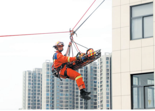
高空绳索营救演练。