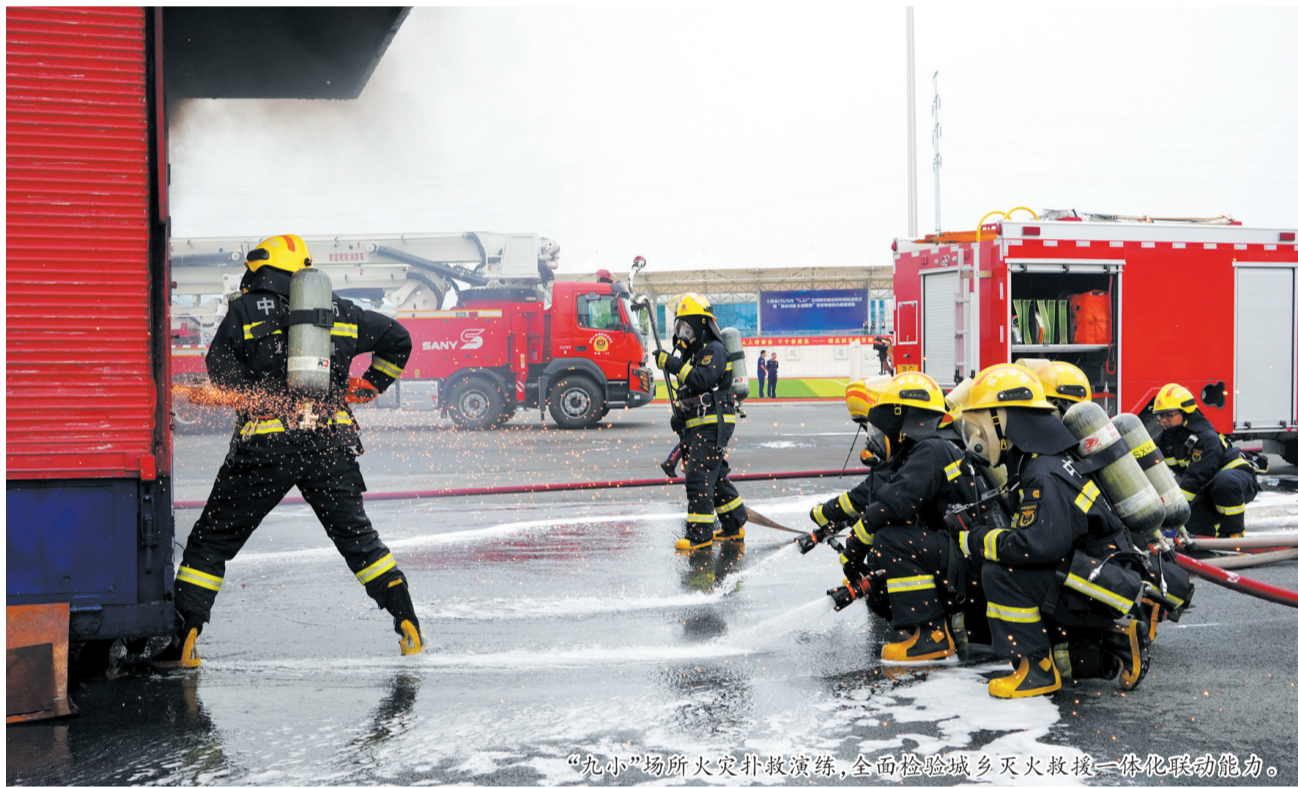
“九小”场所火灾扑救演练,全面检验城乡灭火救援一体化联动能力。