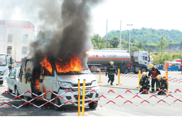
新能源汽车与城市交通事故应急演练。

本报讯 记者徐国文 通讯员袁占彪报道:5月9日,我市在十堰消防救援训练基地举行2026年“5·12”全国防灾减灾宣传周启动仪式暨“使命召唤 车城砺剑”灾害事故综合救援演练。茅箭区、张湾区、各市直单位相关负责人,重点单位安全管理人员及高校师生代表,共计600人参加观摩演练。