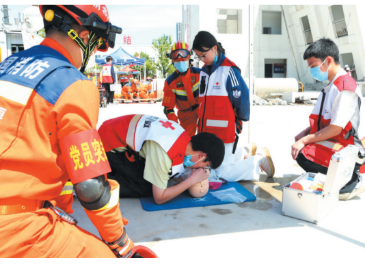
模拟地震救援现场,消防、医护人员联手施救。