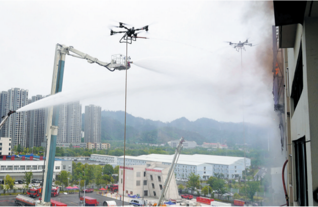
无人机精准定位火情,并配合多种装备进行高空灭火。