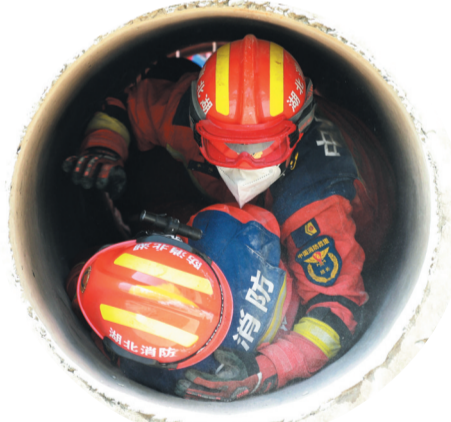
模拟建筑坍塌场景,救援人员在狭小空间施救被困人员。

据了解,此次演练全面检验全市应急救援队伍综合处置能力与跨部门协同作战水平,为守护人民群众生命财产安全、维护社会大局平稳筑牢安全屏障。同时,为全市应急救援实战处置积累经验,持续提升全域应急救援实战能力。