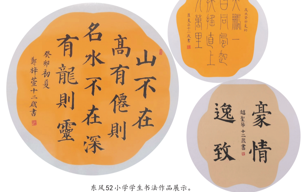
东风52小学学生书法作品展示。