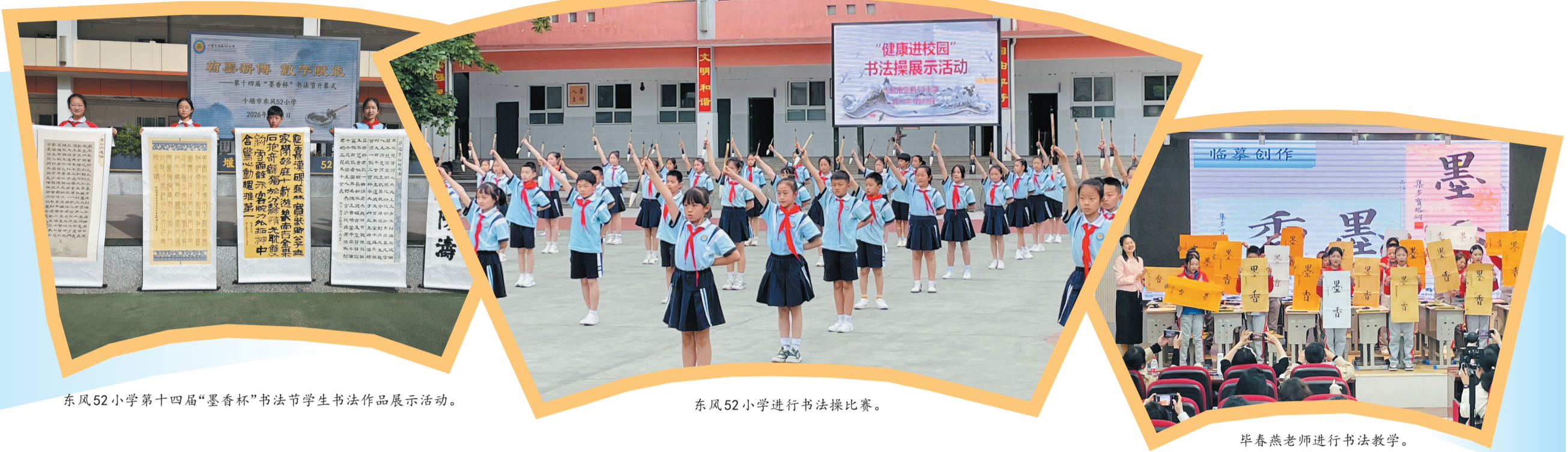
东风52小学第十四届“墨香杯”书法节学生书法作品展示活动。