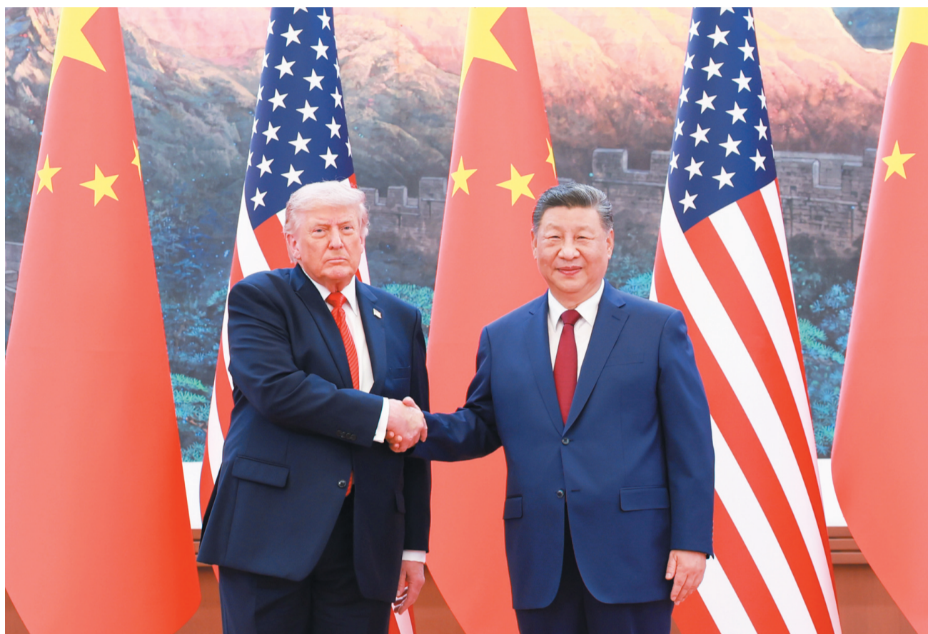
5月14日上午,国家主席习近平在北京人民大会堂同来华进行国事访问的美国总统特朗普举行会谈。