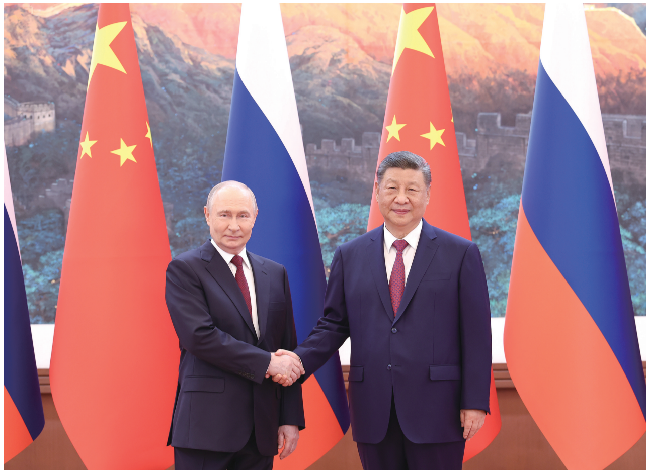
5月20日上午,国家主席习近平在北京人民大会堂同来华进行国事访问的俄罗斯总统普京举行会谈。